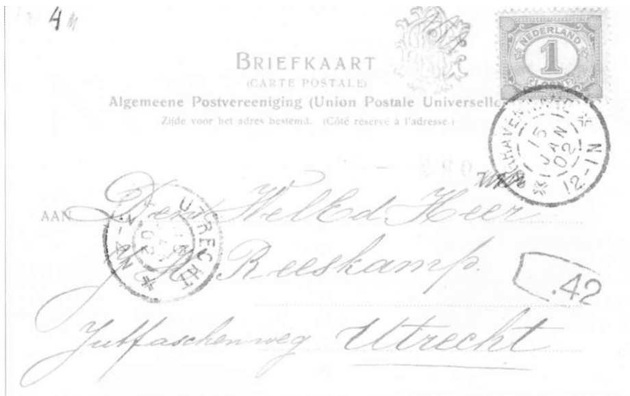
76) Kaart met stempel van 15 januari 1902 met volledig gesegmenteerde binnencirkel.

Daarmee was er een einde gekomen aan de proefneming met Van der Valk's "Heetstempelmachine". Er kan een grote tegenstelling worden vastgesteld tussen de aanbevelingen van de onvolprezen machine (door Van der Valk zelf) en de harde feitelijke bevindingen in de praktijk in het postkantoor te 's Gravenhage.