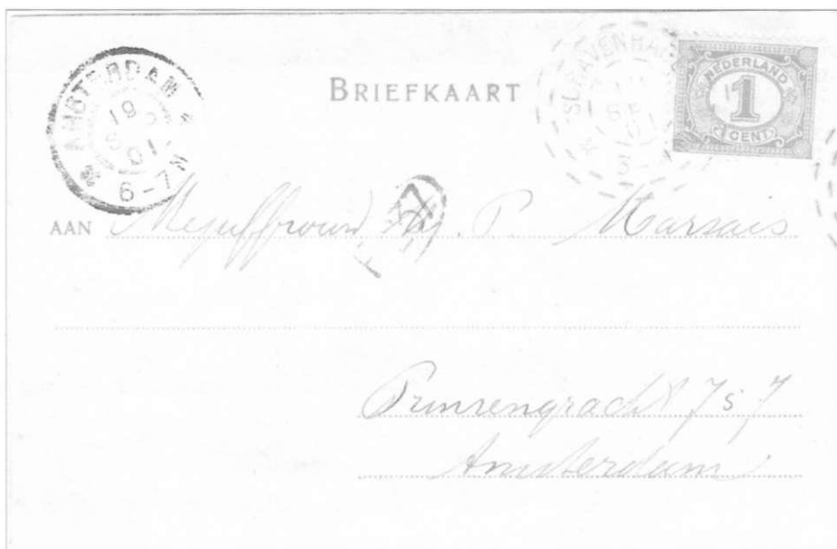
74) Kaart met stempel V201 van 19 sep 01 3-4N.

In het Museum voor Communicatie be- vindt zich een los zegel met een brand- stempel van 31 juli 1901 (9-10V). De her- komst hiervan is niet te achterhalen.