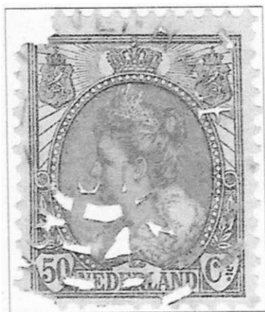
75) Brandstempel op ingebrand zegel 50c Bontkraag, de hoogst bekende waarde met dit stempel.

25 September 1901 is de laatste dag waarop de machine gebruikt is. Veelal wordt in filatelistische literatuur 39) gemeld dat er na eind september alleen nog briefkaarten gestempeld zouden zijn "omdat de inhoud van de brieven soms door doorbranden werd beschadigd". De bron van deze opmerking hebben we niet kunnen achterhalen, maar feit is dat diverse auteurs dit wel steeds van elkaar hebben overgeschreven. Er zijn echter geen poststukken bekend met een datum later dan 25 september 1901, 4-5N.