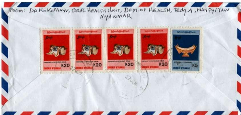
Voor en achterzijde brief verstuurd op 27 juni 2007 vanuit Nay Pyi Taw Op de voorzijde rechtsboven het stempel voor aantekenen met handgeschreven nummer