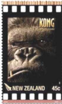
Afb. 2 (boven)

Een moderne remake van de film werd in 2005 opgenomen in Nieuw-Zeeland. De aap werd zo afschrikwekkend mogelijk in beeld gebracht, zoals te zien is op een postzegel van 45 cent (afb. 2). De rol van de lieflijke tegenspeelster werd in deze film gespeeld door Naomi Watts. Ook zij verscheen op een postzegel (afb. 3).