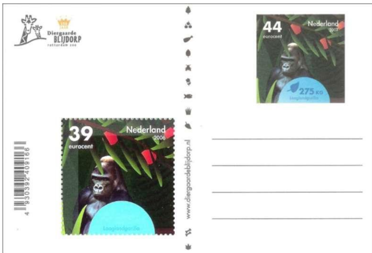
Afb. 4 (inzet van 39 eurocent) en Afb. 5