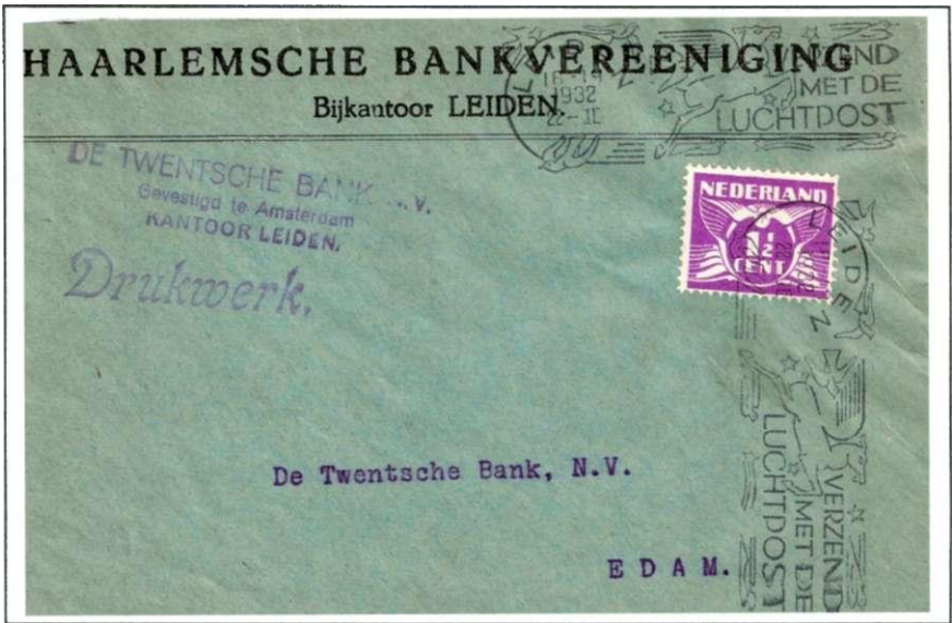
Afb. 60. Nog een vijfde variant van Leiden type XI, nu met uuraanduiding op de bovenste, en het jaartal op de middelste regel. Doordat bij de eerste stempeling de postzegel niet geraakt werd, werd de brief nogmaals, nu op de zijkant, in de stempelmachine ingevoerd.

Sterren komen ook terug in enkele datum- of plaatsnaamstempels 20 van Willem Rozendaal. Deze stempels werden door hem ontworpen op basis van de visie van Van Royen over "eenheid tussen vlag en datumstempel" (Afb. 64a) 21 Na WO II zal Rozendaal een nieuw datumstempel vervaardigen, waarbij er minder nadruk komt te liggen op de stok en meer aandacht voor de vlag (Afb. 64b).