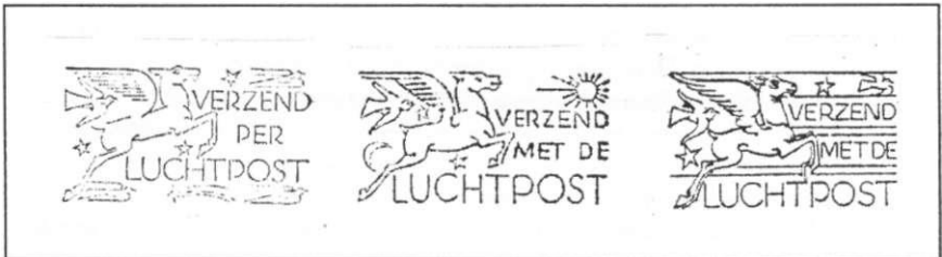
Afb. 61. Er zijn (minstens) vier verschillende stempelvlaggen van het Pegasus-stempel met reclame voor luchtpostverzending. Behalve de vlag in afbeelding 59 en 60 hier drie andere varianten.