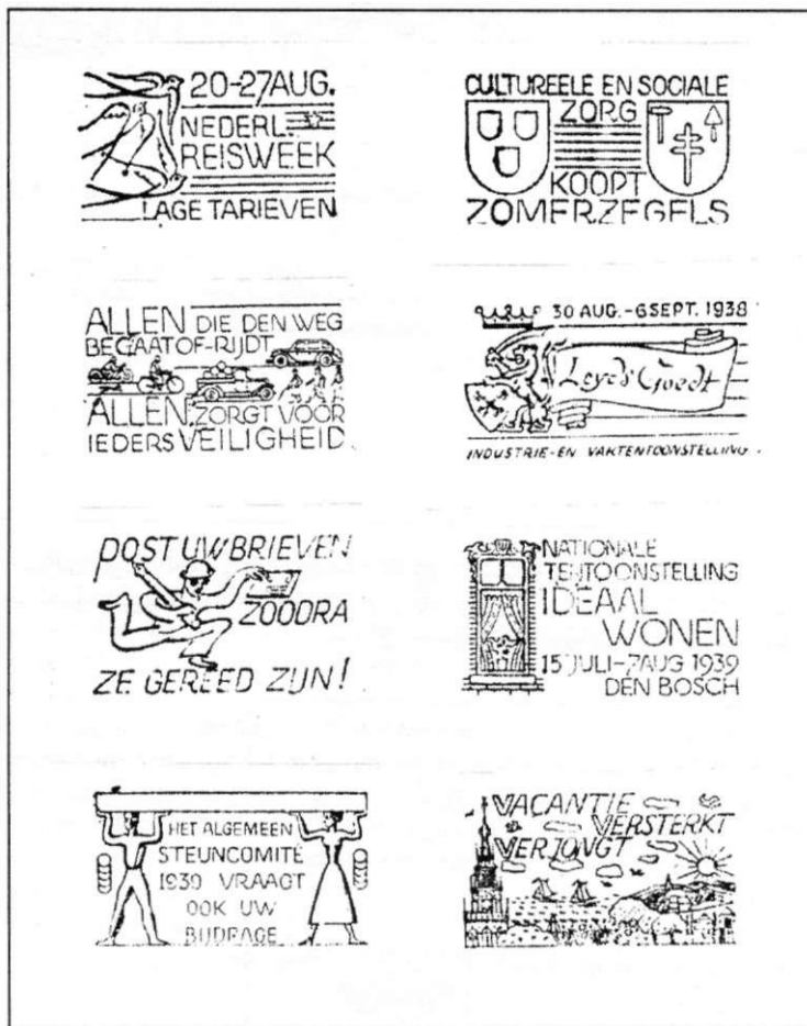
Afb. 65. Een achttal ontwerpen van vlagstempels die door Rozendaal zijn vervaardigd tussen 1934 en 1940.

In afbeelding 65 is een collage te zien van enkele uit de vele tientallen ontwerpen van Rozendaal uit de periode voor de oorlog. Een van zijn laatste ontwerpen uit die tijd is "Vacantie in Vredig Vaderland" (Afb. 66).