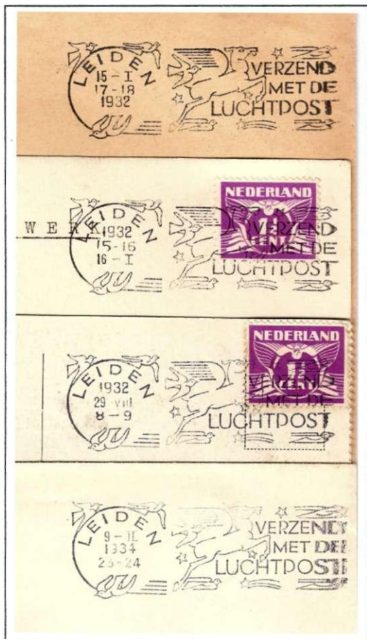
Afb. 59. Vier afdrukken van het vlagstempel "Verzend met de luchtpost" uit Leiden, met het eveneens een typisch ontwerp van Willem Rozendaal is. Merk op dat de volgorde van jaar, datum en uur in de vier afstempelingen verschillend is.

datumstempel" 29 . Niet alleen de stempelvlaggen, maar ook de datumstempels kregen speciale aandacht, zoals hierna nog nader besproken zal worden.