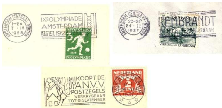
33. (linksboven) Olympiade vlagstempel op NVPH 214 op een drukwerkenveloppe van 4 april 1928.

Na de eerste series toeslagzegels (Tbc 1906, Toorop 1923, en vanaf 1924 de Kinderzegels) nam het aantal verzoeken om Weldadigheidszegels uit te geven sterk toe. In 1927 het Rode kruis, 1928 de Olympiade, 1930 Rembrandt, 1931 Goudse Glazen, 1932 A N W en 1933 Zeemanszegels. Voor 1934 waren ook al aanvragen ingediend door het Nationaal Crisiscomité en wederom de Vereniging tot bestrijding van de tbc, en toen er nog méér aanvragen volgden werd het idee geboren om jaarlijks 4 zegels uit te geven voor zowel sociale als culturele doelen. De betrokken Ministers (Sociale zaken en Onderwijs, Kunsten & Wetenschappen) dienden in overleg met de Minister van Binnenlandse Zaken (PTI) de opbrengst te verdelen. 34