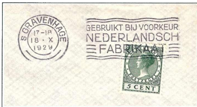
27. Ook reclame voor "Nederlandsch Fabrikaat" gold kennelijk als "algemeen belang", 's Gravenhage, 18 oktober 1929.

1925-1970 153 ). Grote uitzondering hierop is de commerciële reclame die gemaakt is voor Linoleum, in het postkantoorstempel van Krommenie van 1926-1929 (afbeelding 28). Hier heeft het gemeentebestuur van Krommenie de woorden "gemeentelijke belangen" wel heel erg ruim geïnterpreteerd! 154 Let wel: het gaat hier niet om een handstempel en niet om een machinestempel.