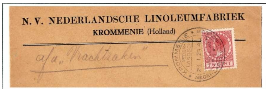
28. Reclamebandstempel Krommenie, met reclametekst: Krommenie / Nederlandsch Linoleum en boven en onder de datum nogmaals Nederlandsch / Linoleum. Geen vlagstempel maar handstempel, maar naast het Blue Band-stempel wel het enige stempel met reclame voor een handelsonderneming. Datum: 23 januari 1929.

Sedertdien wordt in stempels alleen reclame gemaakt voor culturele, sociale en charitatieve doelen en zaken van publiek- en algemeen belang. En natuurlijk voor doelen en aandachtspunten m.b.t. de post zelf.