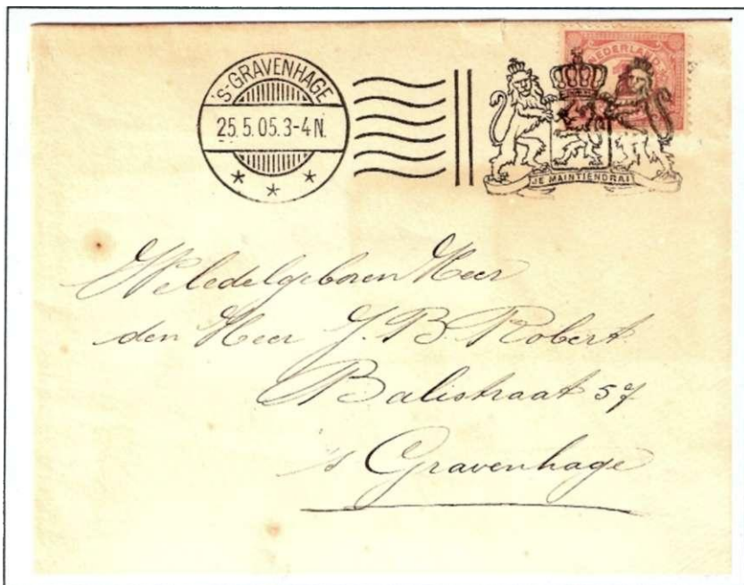
19. Afdruk van vlagstempel met het Nederlandse wapen, uit de Bickerdike-machine op 25 mei 1905.

In deze 4e aflevering wil ik graag aandacht besteden aan de beginperiode van het gebruik van stempelvlaggen: dat zijn de teksten of afbeeldingen (soms helaas alleen maar lijnen) die naast de datumstempel worden afgedrukt. Ook in thematische verzamelingen kunnen vlagstempels een leuke en belangrijke rol spelen. 19) Misschien lukt het u om op "POSTZEGEL TOTAAL" in februari a.s. enkele van deze stempels te bemachtigen ! Voor de prijs van deze stukken hoeft u het meestal niet te laten.