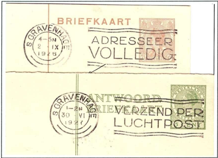
25. Enkele voorbeelden van "postale wenken" uit een Haagse Flier-machine in 1926 en 1927.