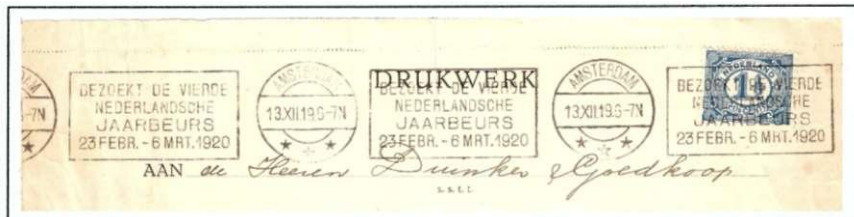
21. Stempelafdruk uit de Krag-machine in Amsterdam, op een grote envelop, zodat de reclametekst voor De vierde (in letters) Nederlandsche jaarbeurs driemaal te lezen is. Datum: 13 XII 1919.

Pas in 1919 verschijnt er voor het eerst een "tekst" in plaats van horizontale lijnen. In 5 plaatsen wordt in dat jaar en ook in 1920 in Krag-machines reclame gemaakt voor het bezoeken van De Vierde Nederlandsche Jaarbeurs (afbeelding 21).