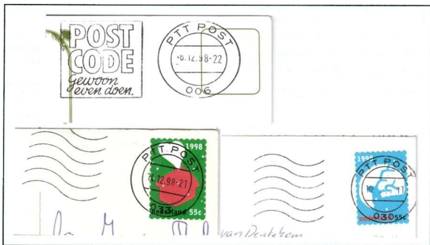
Afb.13. PTT POST-nummerstempels 7) uit 1998, met een driecijferig nummer. Slechts enkele stempels werden gebruikt in combinatie met een Postcode-vlag (006 Zwolle), de meeste met golflijnen (033 Nijmegen). En: waar gewerkt wordt, worden fouten gemaakt, dus ook de instelling van de datum kan incorrect zijn. Voorbeeld: stempel 030 (Maastricht) met als datum 10__11 .

Om een deel van de grote drukte bij de sorteercentra in die drukke periode weg te halen, werd er in 1998 een "noodvoorziening" getroffen. Verspreid over het hele land werden zo'n 140 postvestigingen aangewezen, die belast werden met het stempelen van de post voor de eigen regio. In een aantal plaatsen werd een oudere stempelmachine opnieuw in gebruik genomen. Voor 105 andere tijdelijke stempelplaatsen werden bovendien nieuwe machines van het type "Klüssendorf" aangeschaft. Dit zijn de machines met grote ronde datumstempel (= plaatsnaamstempel) en een vierkante vlag van 3x3 cm. Om de machines jaarlijks op diverse plaatsen in te kunnen zetten werden de plaatsnaamstempels niet voorzien van een naam, maar van de algemene tekst "PTT POST" met daaronder een volgnummer (Afbeelding 13).