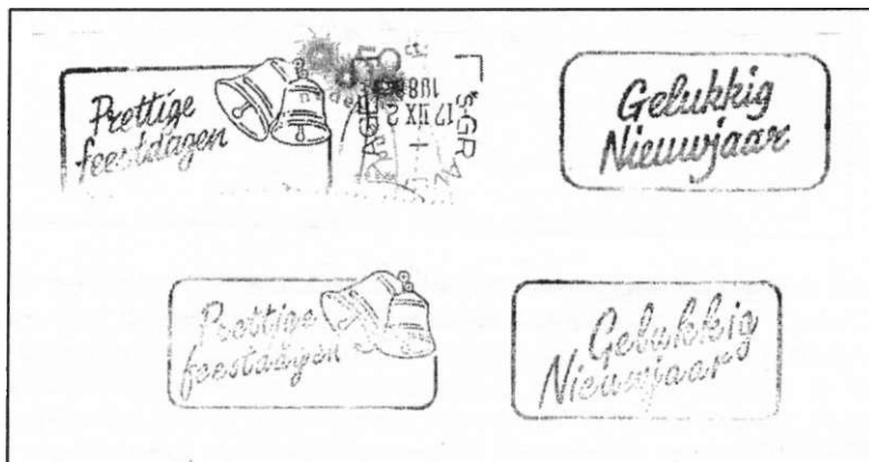
Afb. 12. Stempelvlaggen PF en GN, beide in 2 verschillende handschriften. Prettige Feestdagen uit 's Gravenhage heeft een kopstaande stok, met daarin weer kopstaande maand (XII met schreven), zodat die weer goed staat.

In de KNJ-periode werken de grote sorteercentra natuurlijk op volle toeren, dus komen we ook de "alledaagse" stempels tegen. De slogans in de vlaggen vertonen weinig variatie met die welke door het jaar heen gebruikt worden. Maar soms krijgt U nog "Prettige Feestdagen" of een "Gelukkig Nieuwjaar" toegewenst (Afbeelding 12).