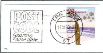
Afb.14 a. (links) TPG POST-stempels uit 2002 met tweecijferig nummer in het stempel. Ook hier zijn de meeste stempels voorzien van een golflijnenvlag, slechts enkele met de Postcode reclame.

De stempels met TPG hebben nu niet meer een maandaanduiding in Arabische, maar in Romeinse karakters. Bovendien bestaan de nummers onder de 100 maar uit twee cijfers. (Afbeelding 14)