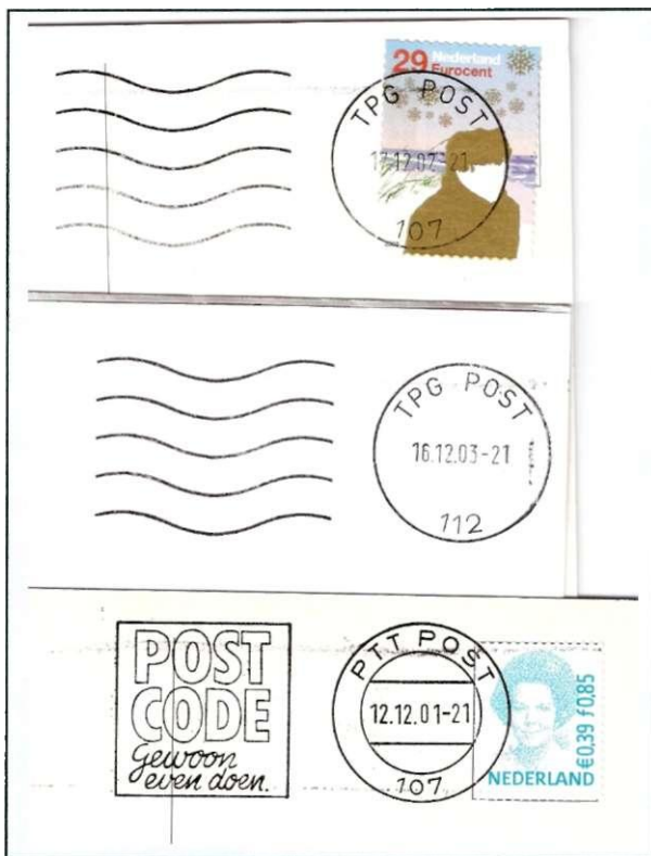
Afb. 15. Twee TPG POST-stempels uit 2002 en 2003 (107 resp. 113) met de nieuwe stempelvorm, en een afdruk van de oude vorm van 107 uit 2001.

In de jaren van 2003 t/m 2005 heb ik betrekkelijk weinig post met nummerstempels gezien. Ik kan me niet aan de indruk onttrekken dat de machines veel minder gebruikt zijn dan in de daaraan voorafgaande jaren. Door te blijven zoeken moet duidelijk worden of alle nummerstempels inderdaad elk jaar gebruikt zijn 9) .