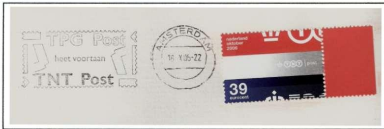
Afb. 18. Nieuw vlagstempel met aankondiging dat TPG post voortaan TNT post is. Gebruikt op 16 oktober 2006, tevens de dag van uitgifte van de TNT-postzegel.