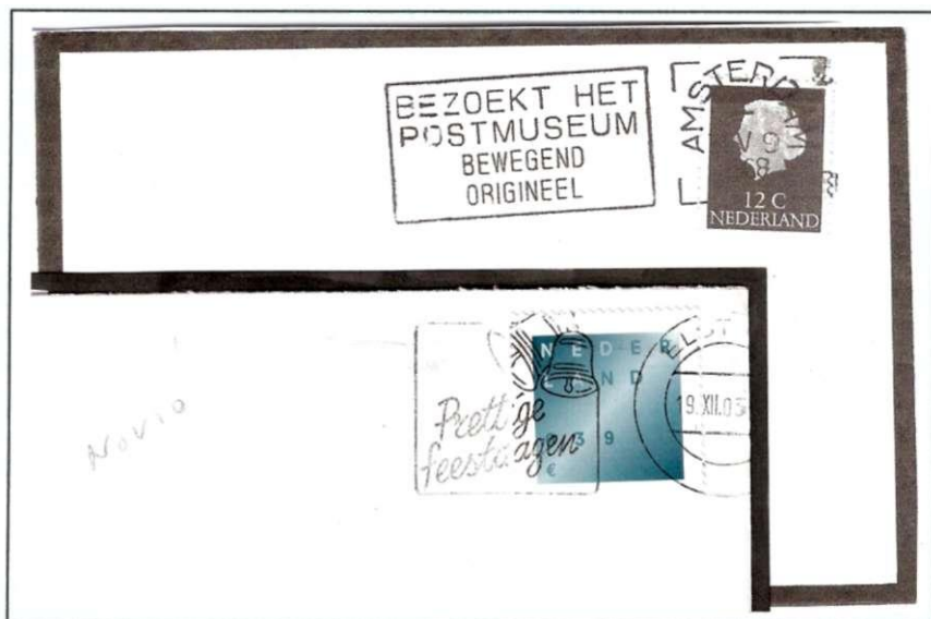
Afb.17. Voorbeelden van rouwbrieven met ongewenste teksten.

Enkele van de Klüssendorf-machines worden door het jaar heen ook gebruikt, en wel voor de stempeling van rouwpost. Omdat ze voorzien zijn van een golflijnenvlag, worden onaangename teksten zoals "Prettige Feestdagen" en "Gelukkig Nieuwjaar" vermeden. Ook in vroeger jaren waren er andere vervelende teksten als "Verpak het in een postpak" of "Postmuseum bewegend origineel" (Afbeelding 17).