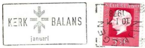
Afb. 10: Machinestempel Nijmegen, 10 januari 1978, met stempelvlag Kerkbalans, waarvan de stok rechtop in de machine heeft gezeten waardoor dat stempeldeel kopstaand op de brief geplaatst is.

In de stok, het stempeldeel met plaatsnaam en datum, wordt ook een uur van stempeling afgedrukt. Vroeger werd dit elk uur bijgesteld, tegenwoordig gebeurt dat nog maar zelden en staat het permanent b.v. op 20 of 21 uur. Maar wel moet elke dag de datum aangepast worden. De stok wordt daartoe uit de stempelkop genomen en na verandering weer teruggeplaatst.