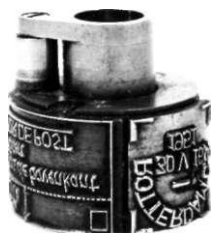
Afb.9: Foto van een stempelkop in de stand waarin die in de machine geplaatst is, dus op z'n kop. (In spiegelschrift: Rotterdam CS. / 30V16 / 1951 en 4cm / langs de bovenkant / vrijlaten / VOOR DE POST). Op deze foto is duidelijk te zien dat vlag en datumstempel twee aparte elementen zijn, die afzonderlijk uitgenomen kunnen worden.

Nu we gezien hebben op welke wijze stempels machinaal worden aangebracht, gaan we nog even kijken naar een daarbij incidenteel voorkomende fout.