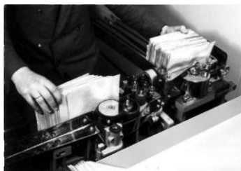
Afb.8: Stempelmachine Type Flier uit het midden van de vorige eeuw. De brieven worden kopstaand door de machine gevoerd en voorzien van een stempel, dat eveneens kopstaand in de machine zit.