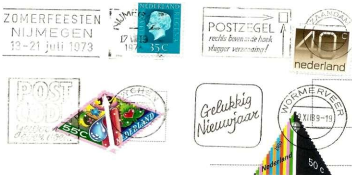
Afb.6: de vier Stempelvarianten die al tientallen jaren, en nog steeds, voorkomen op machinaal gestempelde post: een rechthoekig datumstempel en een klein rond datumstempel, beide met een vlag van 2x4 cm. (Nijmegen en Zaandam) en een klein rond en groot rond datumstempel met een vierkante vlag van 3x3 cm. (Wychen en Wormerveer). (noot 5).

Toen ik die stukken eens goed bekeek, vielen mij een paar dingen op. Allereerst waren dat de "varianten in de stok" (noot 4). Er waren kleine ronde, grote ronde, en rechthoekige datumstempels. En vlaggen waren er in twee formaten: 2x4 en 3x3 cm. (Afbelding 6). Ik kwam er toen al snel achter dat dit te maken had met de verschillende machines die voor de stempeling gebruikt werden.