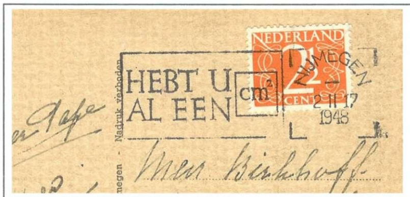
Afb. 4 Nijmegen machinestempel met "stok" Nijmegen 2 II 17 / 1948 en met links de stempelvlag HEBT U AL EEN cm 2 . (Plaatsnaamstempel type XV, volgens catalogisering van Van der Wart).

Na deze algemene inleiding wil ik in deze eerste bijdrage uw aandacht vestigen op een machinestempel dat in 1947 en 1948 o.a. in Nijmegen (noot 3) is gebruikt. De tekst in de "vlag" luidt: HEBT U AL EEN CM 2 , waarbij cm 2 in een omlijnd veldje van een vierkante centimeter is geplaatst (afbeelding 4).