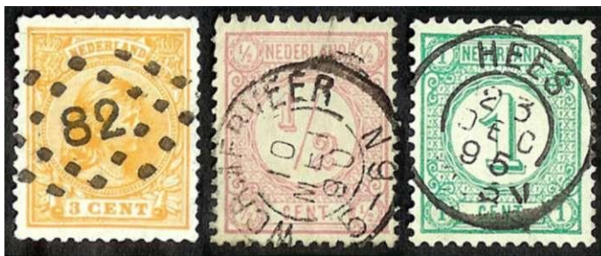
Afb. 1 Nummerstempel en kleinrondstempels op postzegels: Prinses Wilhelmina met hangend haar 3c. (NVPH 34) met punt- of nummerstempel 82 (Nijmegen), Cijfer 1876 1/2 c. (NVPH 30) met kleinrond Wormerveer en Cijfer 1894 1c. (NVPH 31a) met kleinrond Hees.

Veel filatelisten verzamelen, behalve postzegels, ook stempels. Sommige stempels zijn geliefd omdat ze volledig op een postzegel passen (puntstempels, ook wel nummerstempels genoemd, en kleinrondstempels, zie afbeelding 1). Andere stempels, waaronder machinestempels, worden verzameld op geheel poststuk (enveloppe, kaart, formulier etc), of op "uitknipsels". Natuurlijk staat het eenieder vrij om zijn of haar verzameling naar eigen voorkeur in te richten, maar ik zou het verzamelen van stempels op uitknipsels toch met klem willen afraden. Er gaat andere informatie, zoals b.v. de aanleiding voor het tarief en het afgelegde traject met afzender en bestemming, verloren. Ook in tentoonstellingscollecties worden uitknipsels niet op prijs gesteld.