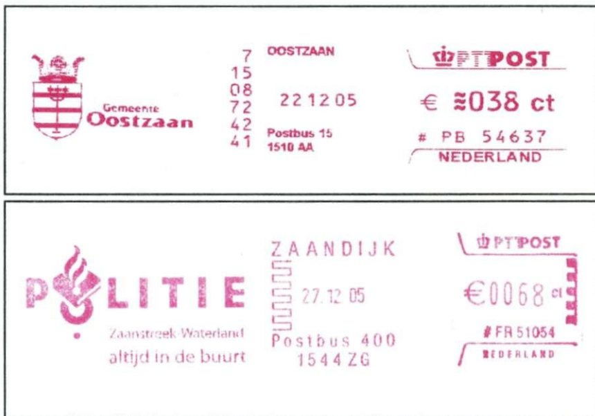
Afb. 2 Frankeermachinestempels (rood). Het gemeentestempel (boven) is afkomstig van een machine van Pitney Bowes, nummer 54637, dat van de politie (onder) komt van een Frama machine, nummer 51054.

Om te beginnen: wat is precies een machinestempel?