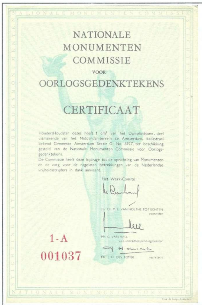
Afb. 5 Certificaat van de Nationale Monumenten Commissie. Zie verder in de tekst.

Zoals meestal bij machinestempels - het gaat daarbij immers altijd om het machinaal afstempelen van grote hoeveelheden post! — is het geen extreem onbekend of lastig stempel. Maar wie weet wat de tekst betekent? Van veel teksten in vlaggen en ook van daarin gebruikte afkortingen is de betekenis vaak minder bekend dan het stempel zelf.