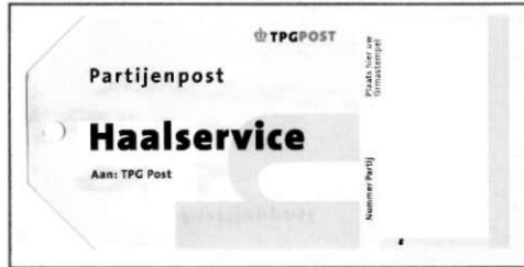
Label P 4794 Partijpost Haalservice

postzaklabel dat hierbij hoort is P 4794 (Haalservice). Elke partij is voorzien van een tweedelig orderformulier. Deel A van dat formulier gaat bij de poststukken in de postzak, deel B wordt verstuurd naar een interne TPG-afdeling.