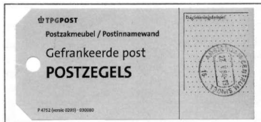
Label P 4752 Postzakmeubel / Postinnemwand Gefrankeerde post Postzegels

De postzaklabels die hierbij gebruikt worden, zijn P 4752 (Gefrankeerde post Postzegels), P 4753 (Gefrankeerde post Frankeermachine) en P 4751 (Gefrankeerde post Pakketten).