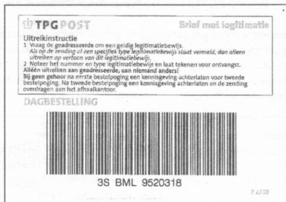
Etiket P 2198 Brief met legitimatie