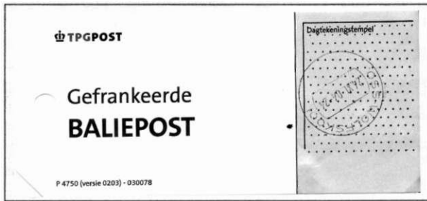
Label P 4750 Gefrankeerde Baliepost

Deze poststukken worden verpakt in zakken met het postzaklabel P 4750 (Gefrankeerde Baliepost).