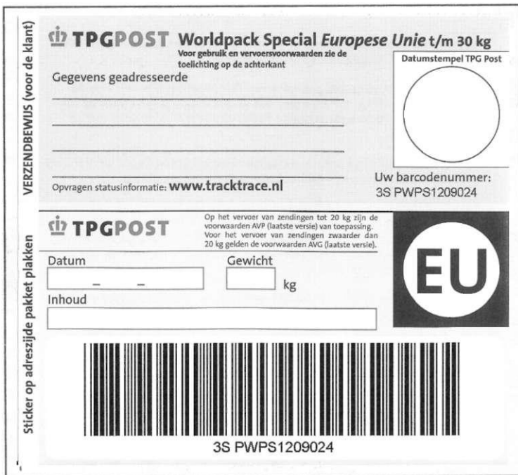
Etiket P 2322 Adressticker/ verzendbewijs Worldpack Special

Deze poststukken worden per subcategorie gebundeld en alle bundels worden in een postzak verpakt met daaraan een postzaklabel P 4702-1 (Depêche voor ....) waarop de naam van de bestemming ingevuld wordt. Alle aangetekende zendingen uit heel Nederland worden tegenwoordig in het sorteercentrum in Arnhem verwerkt, dus op het label zal meestal Arnhem als bestemming vermeld worden.