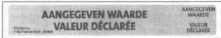
Etiket P 4527 Aangegeven waarde