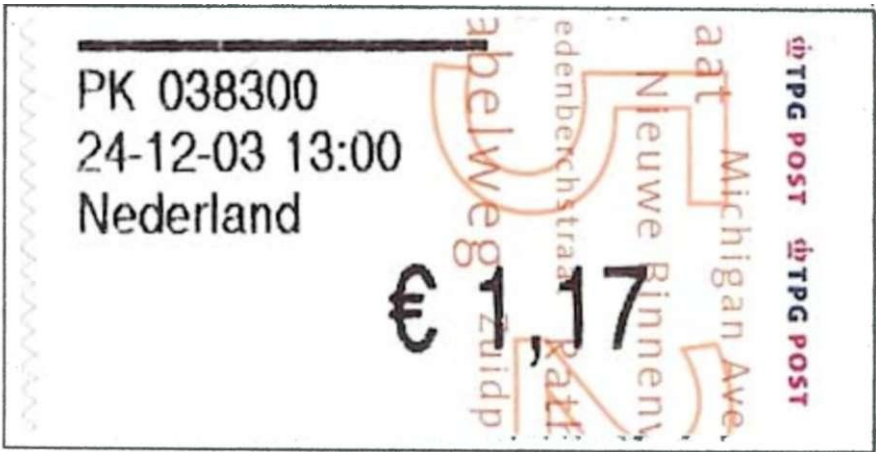
2: baliefrankeerzegel van het type-2003

De voornaamste reden voor de uitgifte van dit nieuwe type zegel is (weer) een economische. Op het nieuwe papier worden namelijk niet alleen "postzegels" geprint, maar ook pakketzegels en de daarbij behorende servicezegels. Daarmee komt op termijn een einde aan de los verkochte pakketzegels en servicezegels, die ongetwijfeld veel duurder in aanmaak waren dan de nieuwe stickers. En bovendien: ook van deze postwaarden hoeft met op de postkantoren geen voorraad meer aan te houden. Het nieuwe papier kan daarnaast ook gebruikt worden voor de aanmaak van losse barcodestickers voor pakketten.