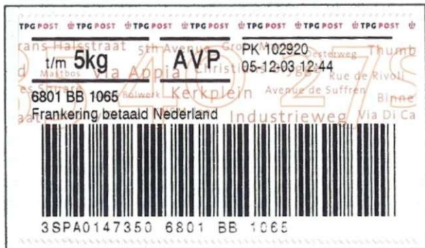
Afb. 3: pakketzegel van het type-2003

Postaal en technisch gezien is dit allemaal razend interessant, maar wat kun je er als eenvoudige verzamelaar mee? Je kunt een blad maken in je album met exemplaren van de nieuwe zegel in verschillende waarden. Je kunt de nieuwe pakketzegels opnemen als het afsluitende hoofdstuk