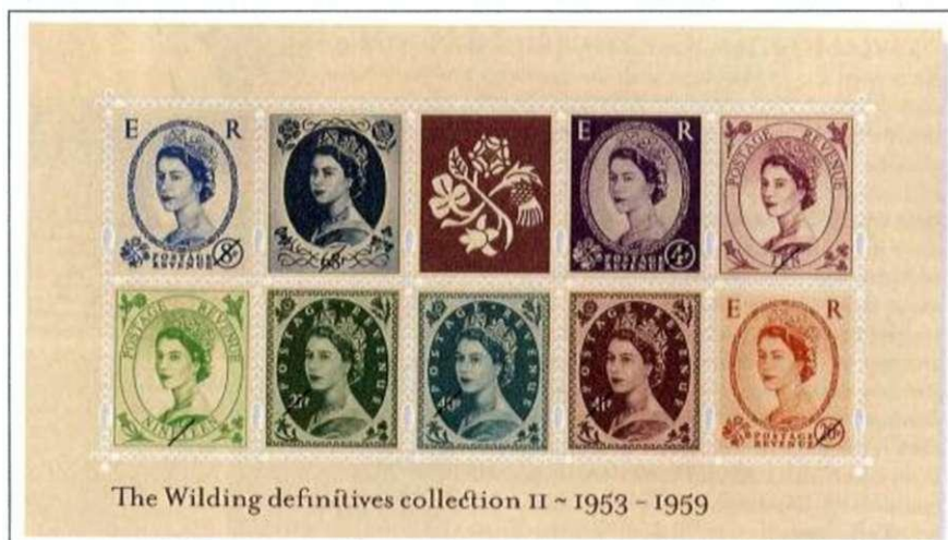
De zegels uit "The Wilding definitives collection II 1953-1959"