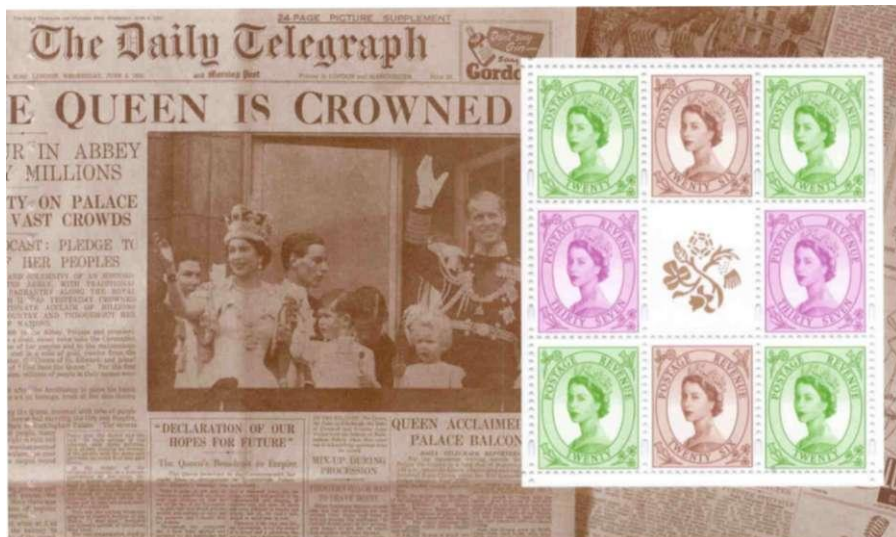
De drie Wildings uit "The Definitive Portrait"