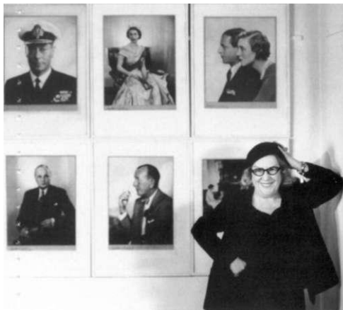
Zelfportret van Dorothy Wilding, staande voor enkele van haar beroemde foto 's

werden nieuwe frankeerzegels ontworpen door verschillende grafische ontwerpers. In verzamelaarskringen worden deze zegels Wildings genoemd.