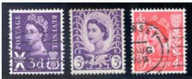
Regionals voor Schotland (Andreaskruis), Wales (draak) en Jersey (wapen)

Ontwikkelingen op het gebied van de postmechanisatie lieten de Wilding-zegel niet ongemoeid. Ten behoeve van de machinale sortering en afstempeling voorzagen men postzegels van optische herkenbare elementen. In 1957-1959 werden verschillende Wildings (met de diverse watermerken) uitgegeven met grafietstrepen op de achterzijde en in de jaren 1966-1967 werd een complete serie (inclusief varianten) uitgebracht met fosforstrepen op de voorzijde.