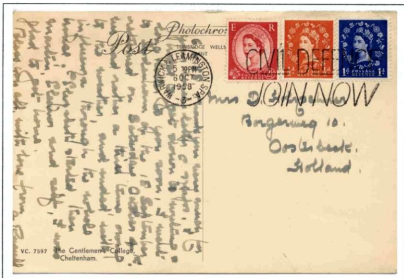
Driekleurenfrankering op een prentbriefkaart naar Nederland (1958)

De zegels werden in omloop gebracht vanaf 5 december 1952 en bleven ruim 15 jaar in omloop. Het portret werd niet alleen afgebeeld op de normale frankierzegels, maar maakte was ook te zien op alle Britse gelegenheidszegels tot 1966. Zoals bekend wordt op Britse zegels met de landsnaam vermeld, maar tonen ze wel altijd een portret van de regerende vorst of vorstin. Die gelegenheidszegels laten we verder buiten beschouwing; het gaat hier om de gewone koninginnekopies.