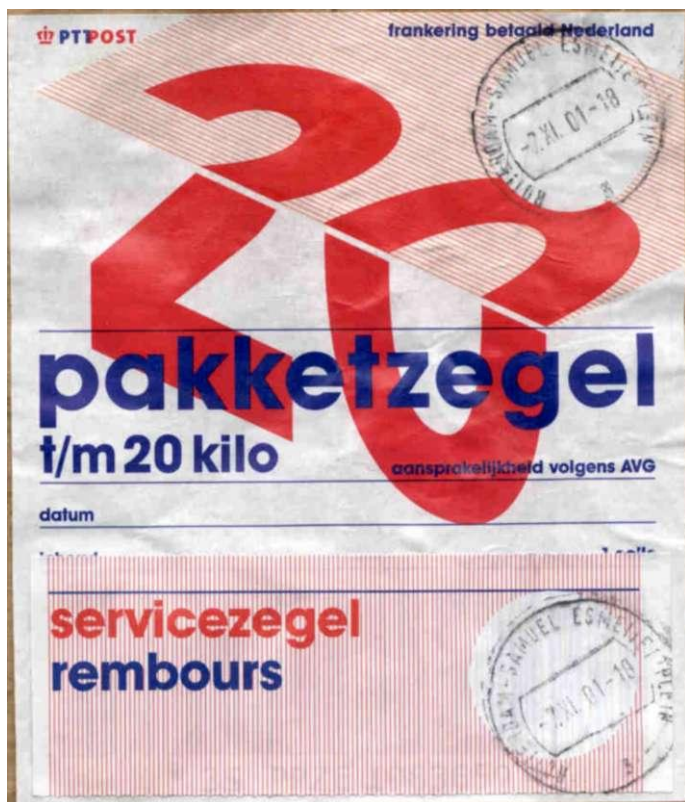
De AVG-zegel met de Rembours servicezegel

pakketten die met aanvullende diensten verstuurd worden. Voor dit soort pakketvervoer werden in juni 2000 wel nieuwe zegels uitgegeven. De zegels zijn als geheel veel lichter van kleur dan voorgaande emissies en hebben als opvallendste kenmerk een gebroken rood cijfer op een gedeeltelijk gekleurde ondergrond. De vijf nieuwe AVG-zegels waren vanaf 1 juni 2000 dus de enige pakketzegels waarbij de mogelijkheid van aanvullende diensten bestond. Bovendien waren deze pakketzegels in boekjes verkrijgbaar tegen gereduceerd tarief. Van de eerste serie AVG-zegels beginnen alle barcodes met "3S PPZE", zodat aan gebruikte zegels niet meteen te zien is of ze los verkocht zijn dan wel in boekjes. De enige aanwijzing zit in de serienummers: alle losse zegels hebben nummers tot en met 2045.500 en alle boekjeszegels hebben nummers die daarboven liggen. In de rechterbenedenhoek van deze zegels staat de tekst "aansprakelijkheid volgens AVG".