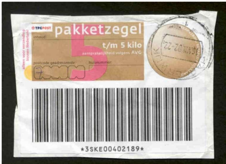
De gebruikte AVG-zegel voor een pakket t/m 5 kilo