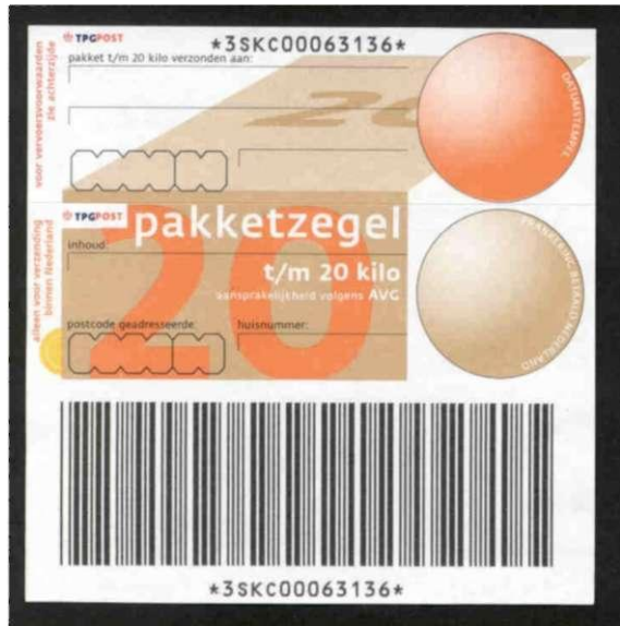
De nieuwe AVG-zegel van 20 kilo met slitlijn

plakken. Eerdere pakketzegels hadden dat ook. Daarbij waren de drie onderdelen van de pakketzegel door een slitlijn van elkaar gescheiden, zodat ze los van elkaar gebruikt konden worden. Bij de eerste oplagen van de AVP-zegel "t/m 5 kilo" is er wat misgegaan met die slitlijnen. Er waren zegels zonder slitlijn, waarbij de drie onderdelen dus één sticker vormen, en de loketmedewerker de schaar moest gebruiken om het nummer voor de afzender veilig te stellen. Daarna kwamen er zegels met één slitlijn,