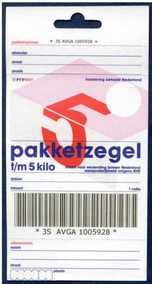
AVG-zegel met ophang sleuf

de nieuwe dienst "Handtekening voor ontvangst" werd geïntroduceerd. Dat leverde twee nieuwe servicezegels op. "Handtekening voor ontvangst" is trouwens niet lang mogelijk geweest: per 1 januari 2002 zou deze dienst weer afgeschaft worden. De mogelijkheid van rembours bleef in juni 2000 bestaan; de betreffende servicezegel "Rembours" werd uitgebracht in de nieuwe vormgeving.