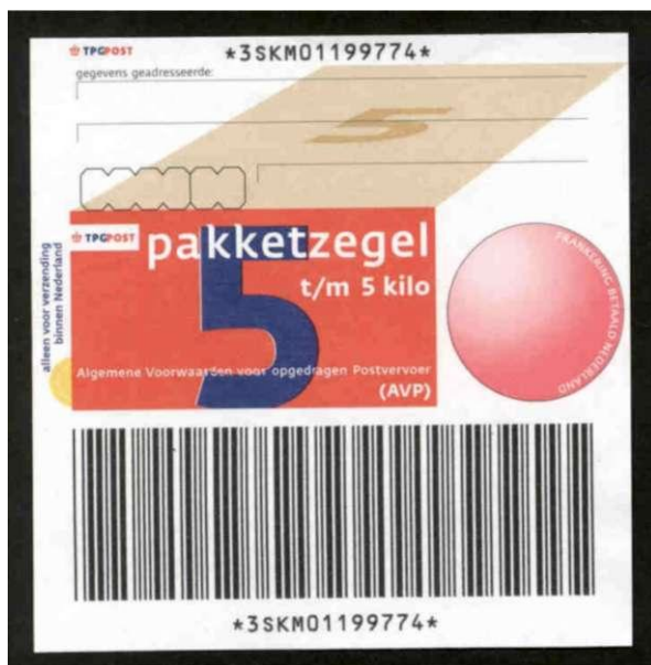
De nieuwe AVP-zegel zonder slitlijn

Het meest raadselachtige deel van de nieuwe zegels is de "adressticker". Bij de AVP-zegels staat hierop de tekst "gegevens geadresseerde". Op de achterzijde van de beschermfolie, dat de afzender behoudt, is ook ruimte voor naam en woonplaats van de geadresseerde ("Het pakket is verzonden aan:"). Daarom denk ik dat de "adressticker" bij AVP-zegels inderdaad bedoeld is om op het pakket te