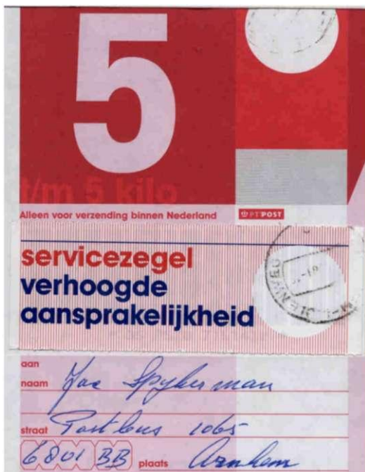
Service zegel Verhoogde Aansprakelijkheid

De nieuwe Postwet van 1 juni 2000 bracht op het gebied van de pakketpost twee belangrijke wijzigingen in: het onderscheid tussen AVP-zegels en AVG-zegels en de introductie van nieuwe servicezegels.