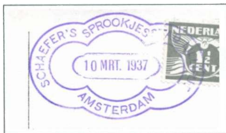
Afb. 1: adreszijde prentbriefkaart

Als we de foto omdraaien, zien we dat het gaat om een prentbriefkaart (afb1). De gedrukte tekst op de achterzijde luidt Schaefer's Sprookjesstad "Lilliput" en de postzegel is afgestempeld met een vreemd gevormd stempel dat diezelfde naam bevat, met de plaatsnaam Amsterdam en de datum 10 maart 1937.