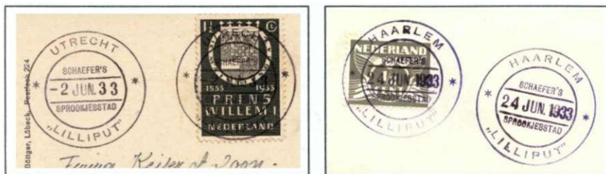
Afb. 3: stempel Utrecht en Haarlem 1933

De tournee van 1933 bracht het gezelschap achtereenvolgens ook naar Nijmegen, Den Haag, Utrecht, Haarlem, Alkmaar, Amsterdam (opnieuw), Enschedé, Maastricht, Heerlen, Groningen en Rotterdam. In al deze plaatsen zijn speciale poststempels gebruikt, waarvan ik hier afdrukken uit Utrecht en Haarlem (afb3) kan laten zien.