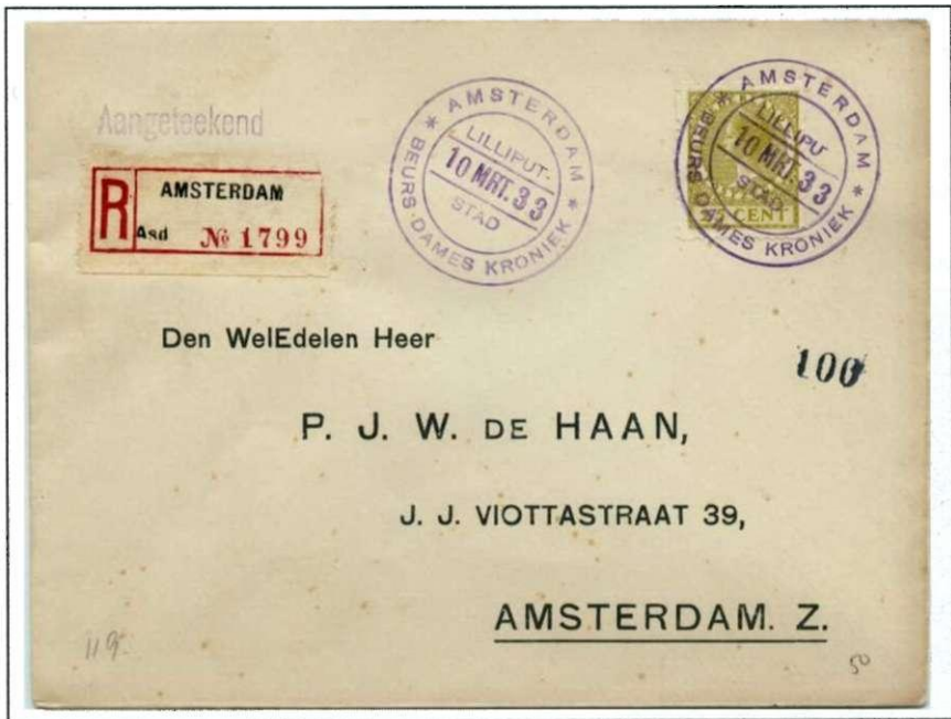
Afb. 2: het stempel op een aangetekende brief uit 1933

Van 3 t.m. 13 maart 1933 was een bijzondere stempel in gebruik voor correspondentie gepost in de Lilliputstad op de Beurs van het tijdschrift "Dameskroniek", gehouden in het R.A.I.-gebouw in Amsterdam-Z. Eén der dwergen stempelde onder toezicht van een postambtenaar met een dubbelringstempel met omschrift *AMSTERDAM* BEURS DAMESKRONIEK, in den verkorten balk de datum, b.v. 7 MRT. 33, in het bovenste segment LILLIPUT- en in het onderste STAD, kleur violet.