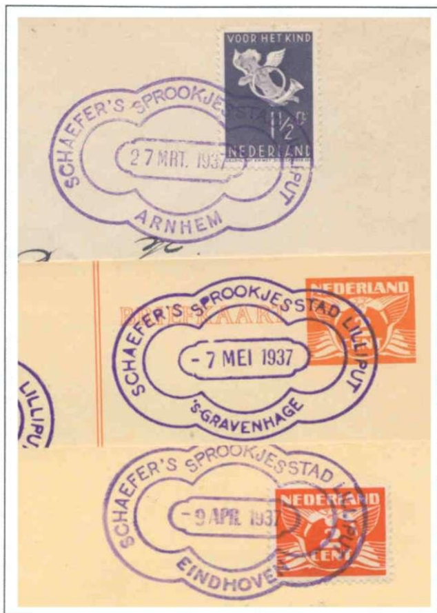
Afb. 5: stempels Arnhem, Eindhoven en Den Haag 1937

Diezelfde brievenbus werd in de andere plaatsen gebruikt. En aan poststukken met afdrukken uit Arnhem, Eindhoven en Den Haag is te zien dat stempelverzamelaars de weg naar de Sprookjesstad wisten te vinden.