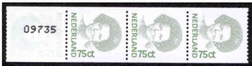
Een strook van 5 rolzegels 75 ct inversie voor grootverbruikers

De zegel voor het brieftarief, 75 ct mosgroen, werd geïntroduceerd in januari 1991 en is een van de interessantste Beatrixzegels. Hij is namelijk slechts een half jaar bruikbaar geweest (omdat het tarief in juli 1991 met een stuiver omhoog ging), maar in die tijd zijn er zeven varianten van verschenen! Naast de velzegel en de tweezijdig ongetande rolzegel zijn er de vier verschillende boekjeszegels en een rolzegel voor grootverbruikers. Tweezijdig ongetande rolzegels voor grootverbruikers zijn op het eerste gezicht gelijk aan de normale rolzegels die aan het loket verkocht werden. Ze onderscheiden zich alleen door een andere nummering op de achterzijde. Ze zijn aangemaakt voor allebei de waarden in de emissie-Beatrix. Van sommige waarden bestaan trouwens ook vierzijdig getande rolzegels.