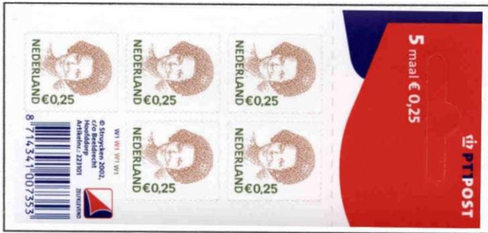
Hangblokje 5 × €0,25 (2002)

karmijn), € 0,40 (cyaanblauw + oranjebruin), € 0,50 (helder karmijnrood + groenblauw), € 0,65 (groen + helder purperviolet), € 0,78 (helder violetblauw + bronsgroen), € 1 (mosgroen + cyaanblauw) en € 3 (lila + mosgroen). En waarschijnlijk is de langlopende emissie daarmee nog niet aan zijn eind gekomen.