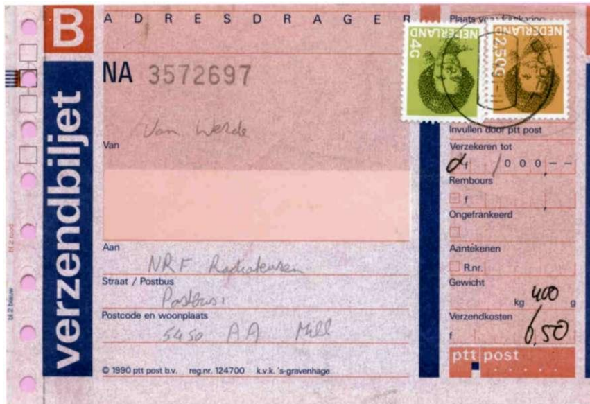
Zegels van 2,50 gld en 4 gld op het verzendbiljet van een pakje (1991)

gld (blauw), 4 gld (geelgroen), 5 gld (blauwgroen) en 6,50 gld (roze). Die laatste zegel diende voor de frankering van aangetekende brieven. Van de waarden 70 ct, 1 gld, 2 gld en 6,50 gld verschenen ook tweezijdig ongetande rolzegels, terwijl er een postzegelboekje verscheen met nog twee varianten van de 70 ct: respectievelijk links ongetand en links en boven ongetand.