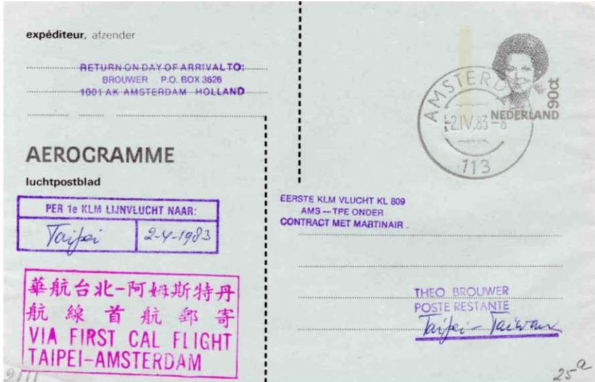
Luchtpostblad 90 ct (1983)

Bij de beschrijving van deze emissie mogen de postwaardestukken natuurlijk niet vergeten worden: in 1982 verschenen een binnenlandbriefkaart (50 ct grijs en bruin), een buitenland briefkaart (65 ct grijs en geelgroen), een postblad (55 ct donkergrijs op lichtgrijs) en een luchtpostblad (90 ct grijs en zwart op lichtblauw).