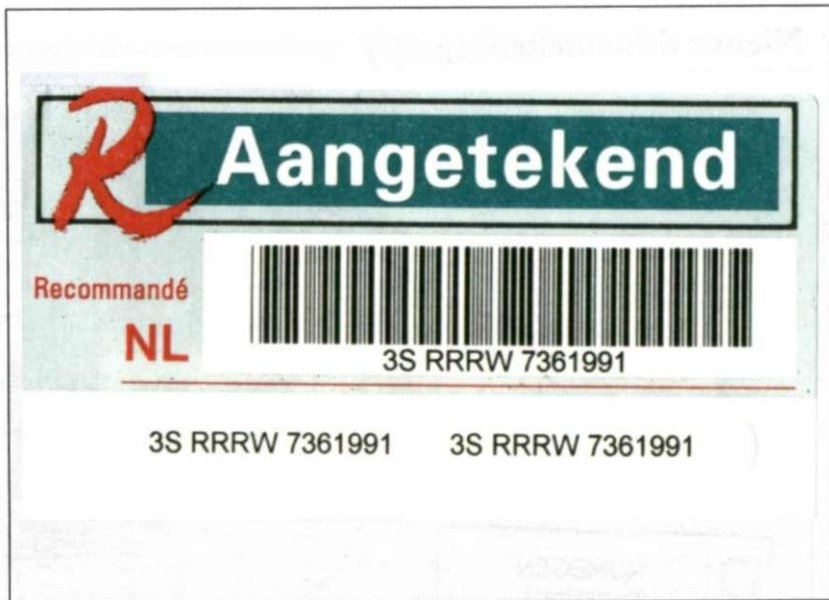
Barcodesticker "3S RRRW(7 cijfers)" met nummerstickertjes naast elkaar