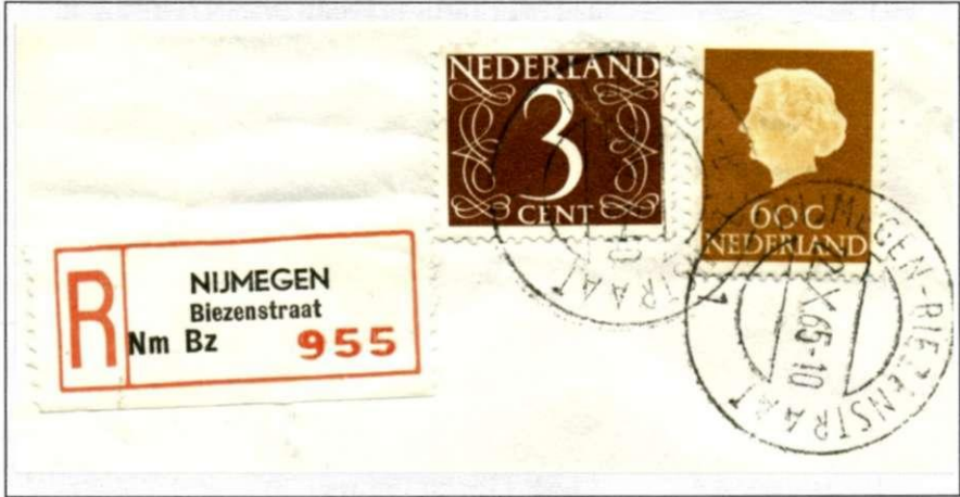
Aangetekende brief uit 1965, stempel en strookje "Nijmegen-Biezenstraat"

In 1997 verdween het aantekenstrookje met kantoornaam. Het werd tot verdriet van veel verzamelaars vervangen door een barcodesticker zonder plaatsaanduiding (*). Menigeen heeft op dat moment zijn verzameling aantekenstrookjes afgesloten, al bleef het verzamelen van aangetekende brieven natuurlijk nog best interessant.