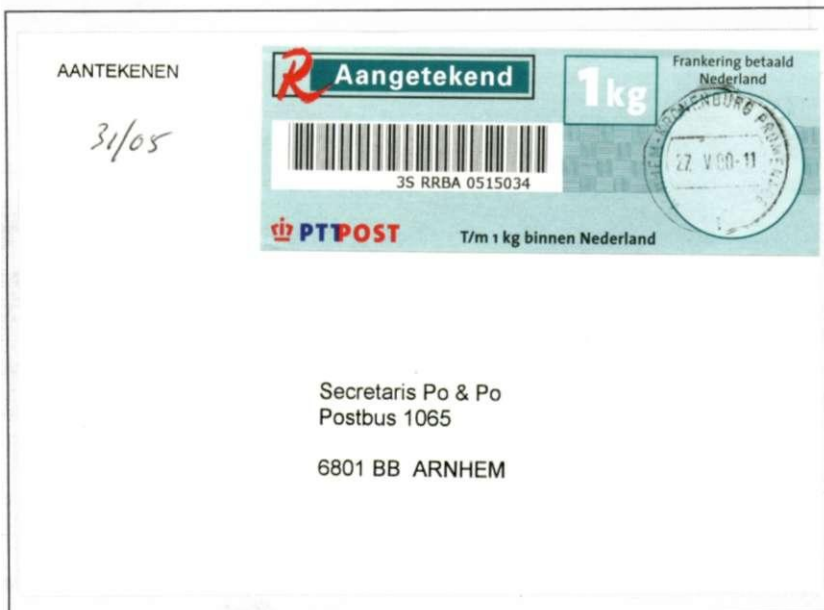
Aangetekende brief, stempel "Arnhem-Kronenburg Promenade", mei 2000