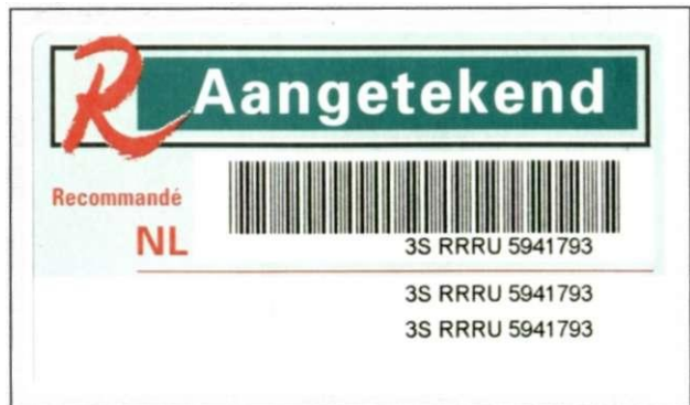
Barcodesticker "3S RRRU(7 cijfers)" met nummerstickertjes onder elkaar