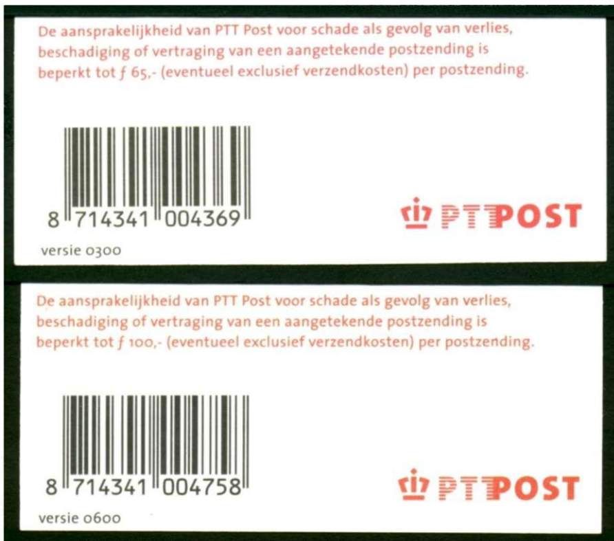
Achterkant verzendbewijs maart (versie 0300) en juni 2000 (0600)

Dat zijn vragen waarop wij geen antwoord weten. Voor ons is de aantekenzegel een postale plakker met frankeerwaarde, die wij beschrijven omdat wij vinden dat ook dit verschijnsel posthistorisch interessant is.