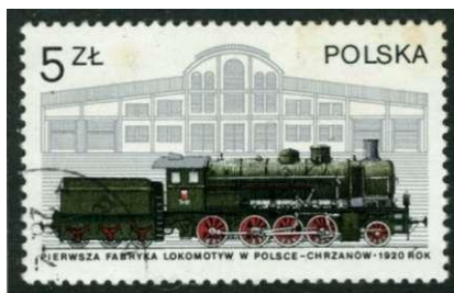
Locomotief type Tr 21 gebouwd door Fablok

Zoals in veel Europese landen kwamen de eerste locomotieven uit het buitenland. Maar al snel bouwde men in Polen zijn eigen stoom locomotieven. De firma Fablok in Chrzanow is een belangrijke locomotieven fabriek. Het land