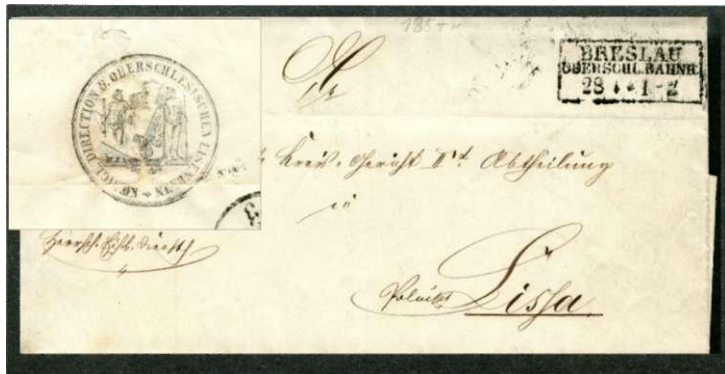
Brief van de (Duitse) Oberschlesischen Eisenbahn in Breslau (nu Wrocław). Op de achterzijde het wapen van de maatschappij (inzet)

Tegenwoordig valt de Poolse spoorwegmaatschappij PKP (Polskie Koleje Państwowe) onder het Ministerie van Transport, maar dat is niet altijd zo geweest. Tijdens het ontstaan van de spoorwegen bestond Polen namelijk niet. Toen in 1845 de eerste trein in Polen ging rijden, was het land verdeeld tussen Duitsland, Rusland en Oostenrijk. De start was in het Russische deel en het traject liep van Warschau naar Grodzisk Mazowiecki. De lijn werd doorgetrokken naar Maczki, waar hij aansloot op het Duitse en Oostenrijkse spoorweginet. Samenwerking was er in die jaren niet zo veel, met name Rusland was bang voor dreiging uit het westen.