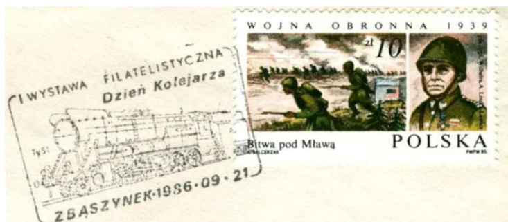
Stempel "Dag van het Spoorwegpersoneel"

Voor de Eerste Wereldoorlog was het spoorwegpersoneel een van de pijlers bij de opstanden tegen Rusland. Ook nu nog zijn zij goed georganiseerd en worden er jaarlijks Dagen van het Spoorwegpersoneel gehouden. Een onderdeel van deze dagen zijn sportwedstrijden. Filatelisten kunnen hun hart ophalen aan de vele gelegenheidsstempels vanwege deze dagen.