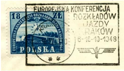
Zegel en stempel ter gelegenheid van de Conferentie over dienstregelingen in Krakow

Zowel nationaal als internationaal is regelmatig overleg nodig om zaken op elkaar af te stemmen. Voor internationale conferenties is Polen