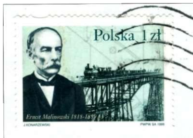
Ernest Malinowski, een van de ingenieurs van de Andeslijn

Poolse ingenieurs waren niet alleen actief in hun eigen land, maar ook ver buiten de grenzen. Ernest Malinowski bouwde mee aan de Andeslijn in Peru, 's werelds hoogstgelegene spoorlijn, en Stanislaw Gzowski was betrokken bij de ontwikkeling van de spoorwegen in Canada.