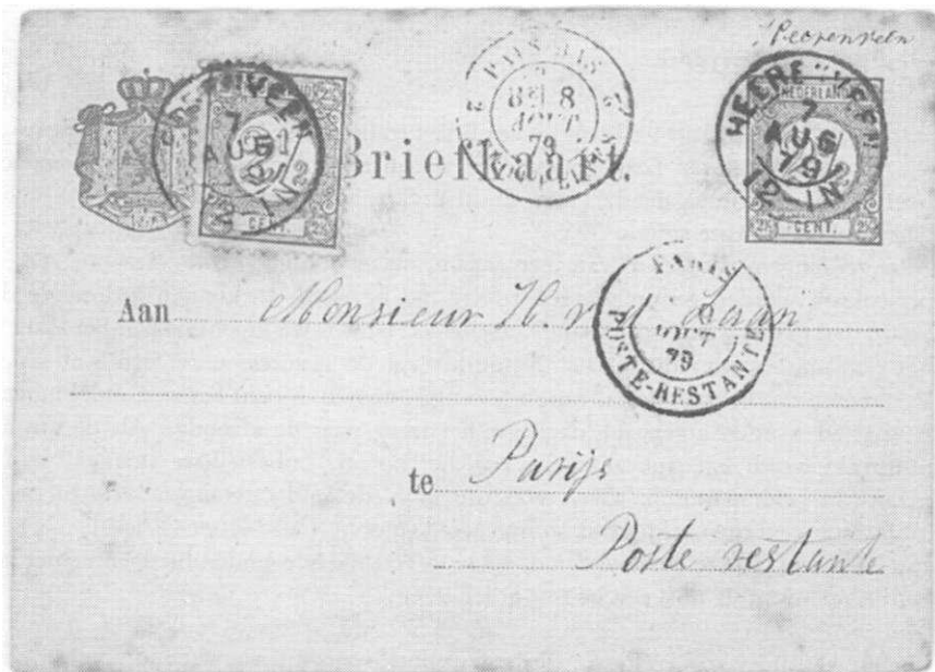
Afb.2 Brief naar Parijs op 7 augustus 1779

De volgende brief (afb 3) werd verzonden van Frankrijk naar Rotterdam (aankomststempel Rotterdam 21-VIII-1930 op achterzijde) De geadresseerde was inmiddels vertrokken, en de brief werd nog dezelfde dag doorgestuurd naar Duinbergen (België) (Aankomststempel achterzijde Duinbergen 21-VIII-1930).