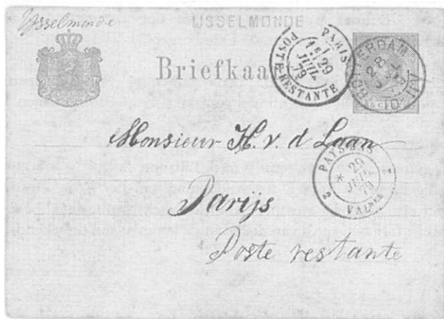
Afb. 1 Brief naar Parijs op 28 juli 1879

Onder verzamelaars is Poste Restante vooral bekend vanwege de vele "eerste vluchten" welke meegegeven werden, ter verkrijging van een speciaal stempel, en niet met de bedoeling om afgehaald te worden op het ontvangend kantoor. Gaat men echter op zoek naar "niet maakwerk" dan is het aantal beschikbare stukken slechts gering, en is elke brief of kaart een aanwinst.