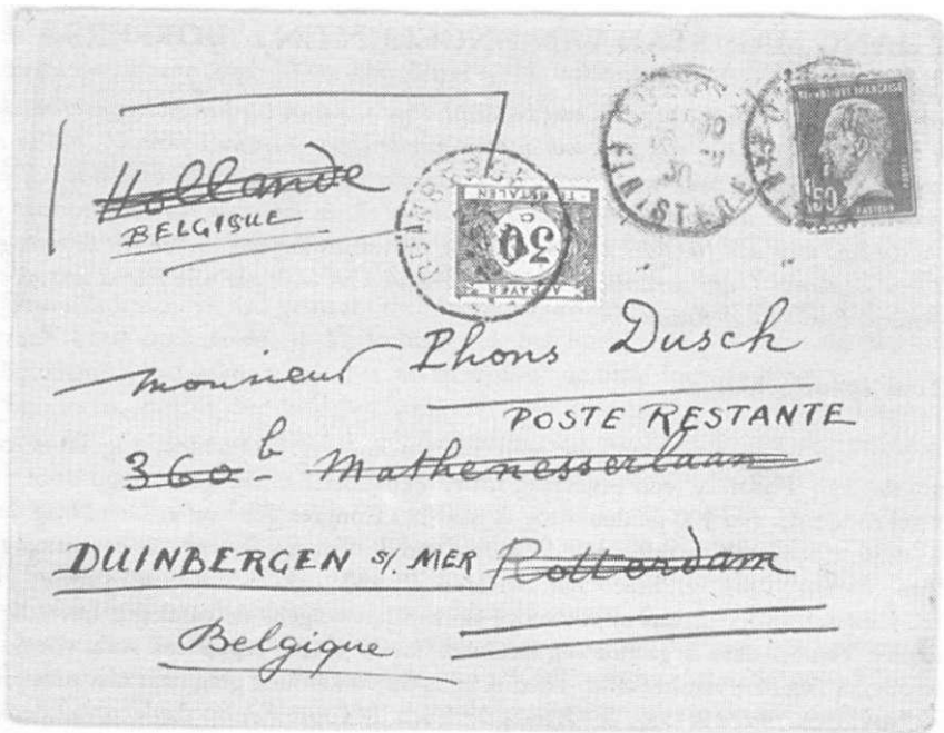
Afb.3 Brief vanuit Frankrijk via Rotterdam naar België met portzegel ter voldoening van het poste restante recht.