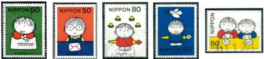
Afbeelding 1: Japanse postzegels "Dag van de Correspondentie" 1998

En hij heeft er succes mee: Bruna's kinderboeken worden over de hele wereld goed verkocht en PTT Post heeft verschillende postzegels van zijn hand uitgegeven. Onlangs hebben ook de Japanse posterijen van zijn diensten gebruik gemaakt. Ter gelegenheid van de "Dag van de Correspondentie" werden maar liefst 5 postzegels uitgegeven waarop typische Bruna-kinderen zijn afgebeeld (afbeelding 1). Bij de serie hoort ook een postzegelboekje.