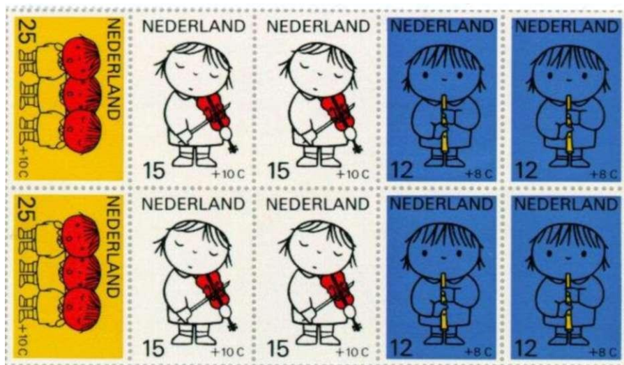
Afbeelding 4: Blok kinderzegels 1969, NVPH nr 937

Voor PTT Post was Dick Bruna in 1969 een voor de hand liggende keuze toen het ging om een ontwerper te vinden voor de kinderzegels van dat jaar. Het werden vijf postzegels met als thema "Kind en muziek", waarbij bleek dat Bruna's tekeningen op klein formaat niets van hun zeggingskracht verliezen. De drie laagste waarden werden uitgegeven in een blokje (afbeelding 4) dat door de schooljeugd tijdens de Kinderpostzegelactie aan de man werd gebracht. Liefhebbers van zijn werk maken we attent op de eerstedag-envelop (E80) die bij de kinderzegels van 1969 hoort. Op die envelop is namelijk ook nog een door Bruna ontworpen vignet te vinden. Het bijbehorende eerstdagstempel lijkt overigens niet van zijn hand.