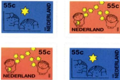
Afbeelding 5: Decemberzegels 1995, NVPH nrs 1662-1663

In 1995 kreeg Bruna opnieuw een opdracht van PTT Post. In dat jaar draaide de hele decembercampagne van de Post om Dick Bruna. Hij ontwierp de twee decemberzegels ("Kinderen kijken naar ster" en "Kinderen spelen met sterren"), de eerste zelfklevende postzegels in de Nederlandse geschiedenis (afbeelding 5). Deze kortingzegels werden uitsluitend uitgebracht in velletjes van twintig stuks. Voor de eerstedagenvelop ontwierp Bruna naast het vignet dit keer ook het stempel. En er verschenen een ECU-brief en een Telebrief, die filatelistisch geen enkele betekenis hebben, maar wel voorzien zijn van respectievelijk een Bruna-munt en een Bruna-telefoonkaart, en allebei van een ander stempel...