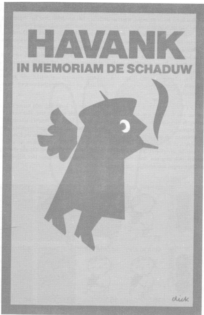
Afbeelding 2: omslag van een Zwarte Beertjes-pocket