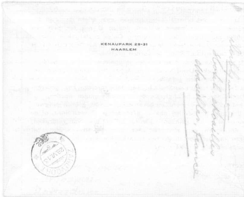
Afbeelding 3: Voor en achterzijde brief teruggestuurde post van de curator