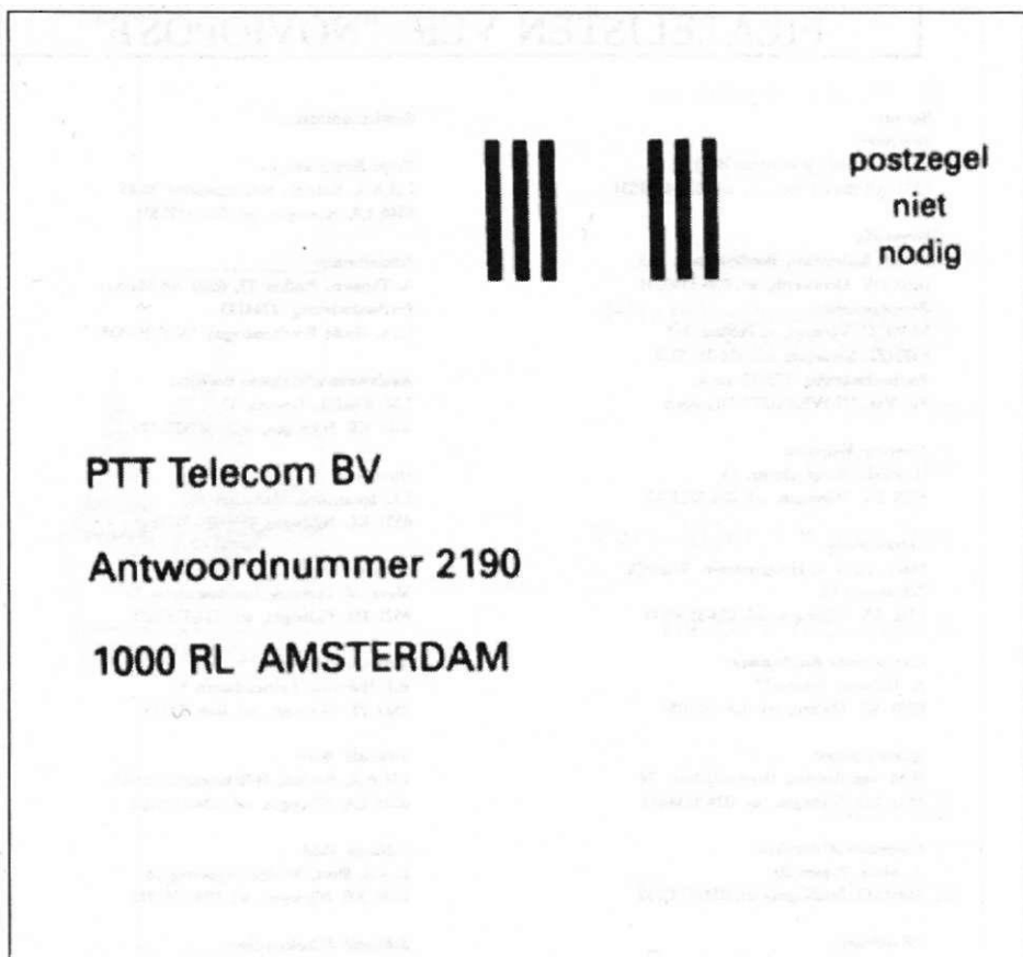
Afbeelding 2: De streepjescode voor PTT-Telecom (mei 1997)

Het eerste voorbeeld van zo'n eigen code zagen we in mei 1997, op de antwoordkaart waarmee telefoon-abonnees aan PTT-Telecom konden laten weten welk abonnement ze kozen. Als alle abonnees die antwoordkaart teruggestuurd hebben, moet het gaan om ettelijke miljoenen stuks. Dan loont zo'n eigen code de moeite.