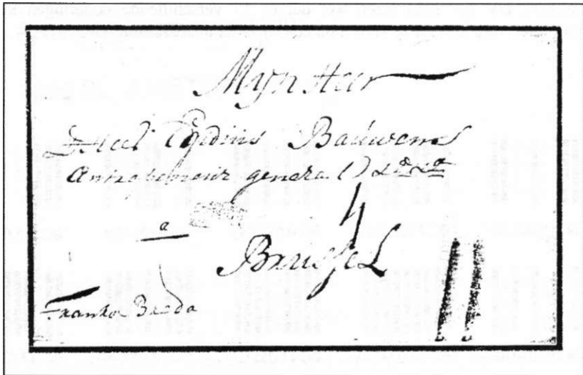
Brief, verzonden in 1749 van Heusden naar Bruxelles. Franco Breda. Deelport Breda - Antwerpen 2 sols en eindport in Brussel 4 sols.