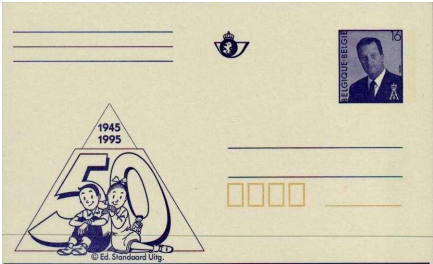
Afb 6. Briefkaart 1996: Suske en Wiske

Ondanks het fabrieksmatige karakter van de latere albums blijven Suske en Wiske onverminderd populair. Ze verschenen in 1987 op een Jeugdfilatellie-zegel (afb. 5), in 1995 op een Belgische briefkaart (afb. 6) en werden in Nederland in 1996 geëerd met een blokje van twee postzegels (afb. 7), waarvan de ene ook in een velletje van 10 stuks werd uitgebracht.