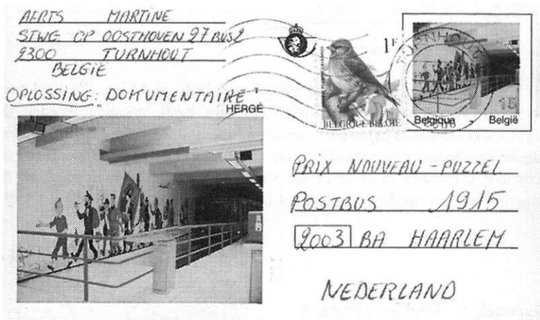
Afb. 2. Metro-briefkaart 1993: stripfiguren van Hergé

Georges Remi, die veel bekender is onder zijn pseudoniem Hergé, wordt wel de vader van het Belgische stripverhaal genoemd. Hergé's schepping Kuifje (Tintin) is een jonge journalist die overal ter wereld terecht komt in netelige situaties, die hij steeds tot een goed einde weet te brengen. Hij wordt hierbij geholpen door zijn slimme hondje Bobby en de goedbedoelende zeebonk Kapitein Haddock, terwijl de detectives Jansen en Jansens en talloze bijfiguren kleur geven aan de verhalen. Van Kuifje in de Sovjetunie (1929) tot aan Kuifje en de Picaro's (1976) heeft tekenaar Hergé zijn held geen dag ouder laten worden. Kuifje staat afgebeeld op een Jeugdfilatelie-postzegel uit 1979 (afb. 1). Ook op een briefkaart uit 1993 ziet men de jonge reporter: zegelbeeld en illustratie tonen stripfiguren van Hergé op een muurschildering in de Brusselse Metro (afb. 2).