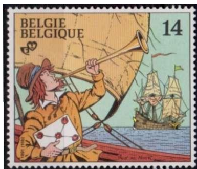
Afb. 4. Jeugdfilatelie 1991 (2): Cori de Scheepsjongen

Een andere belangrijke medewerker van Hergé was Bob de Moor, die heel veel getekend heeft voor het weekblad Kuifje . Tot zijn beste creaties worden de verhalen rond Cori de Scheepsjongen gerekend, zee-avonturen die zich afspelen tegen het decor van historische gebeurtenissen. De onoverwinnelijke vloot (over de Spaanse Armada) verscheen in 1978 in het Nederlandse jeugdblad Eppo. Cori de Scheepsjongen is te zien op de tweede zegel uit het Jeugdfilatelie-boekje uit 1991 (afb. 4).