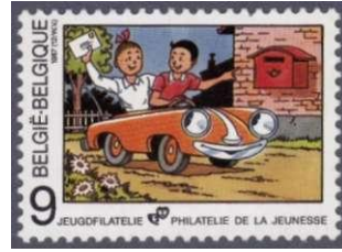
Afb 5. Jeugdfilatellie 1987: Suske en Wiske

Een heel ander soort stripverhaal, dat vooral in de beginjaren zijn Vlaamse afkomst bepaald niet verloochende, is Willy Vandersteens schepping Suske en Wiske . Deze brave jongelui, van wie de familiebetrekkingen met Tante Sidonia en Lambiek altijd wat onduidelijk blijven, beleven hun avonturen niet alleen in het heden, maar - dankzij de tijdmachine van Professor Barrabas - ook in het verleden en in de toekomst. Er zijn al enkele honderden (!) Suske & Wiske-albums verschenen, wat mogelijk gemaakt werd door het studio-systeem dat Vandersteen opzette. Uit diezelfde studio komen andere veedelige stripreeksen, zoals De Rode Ridder, Bessie en Karl May. Overigens werkte Vandersteen in zijn jonge jaren ook voor het weekblad Kuifje .