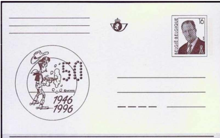
Afb. 9. Briefkaart 1996: Lucky Luke

door René Goscinny, die we ook kennen als de tekstschrijver van Asterix & Obelix. De Post portretteerde Lucky Luke twee maal: op een postzegel (Jeugdfilatelie 1990) en op een briefkaart ter gelegenheid van zijn 50e verjaardag (1996, afb. 9).