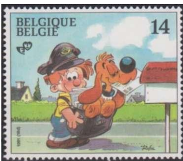
Afb. 10. Jeugdfilatelie 1991 (4): Billie en Bollie

Andere tekenaars die voornamelijk met Robbedoes geassocieerd worden zijn Roba, wiens Billie en Bollie heel populair werden (Jeugdfilatelie-boekje 1991, afb. 10) en Macherot met verhalen rond de eikelmuis Chlorophyl (Jeugdfilatelie 1996). Tot deze groep behoort ook Peyo, de schepper van De Smurfen , de kleine blauwe mannetjes die in 1984 een Jeugdfilatelie-zegel voor zich op-eisten.