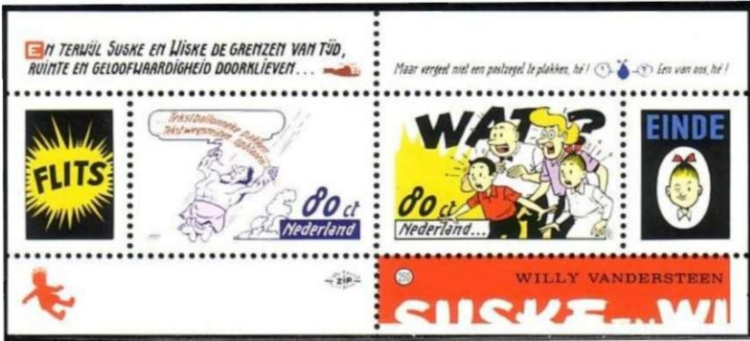
Afb 7. Nederland 1996: blokje met Jerom, Suske en Wiske, Lambiek en Sidonia