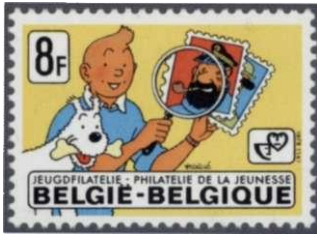
Afb. 1. Jeugdfilatelie 1979: Kuifje

Georges Remi, die veel bekender is onder zijn pseudoniem Hergé, wordt wel de vader van het Belgische stripverhaal genoemd. Hergé's schepping Kuifje (Tintin) is een jonge journalist die overal ter wereld terecht komt in netelige situaties, die hij steeds tot een goed einde weet te brengen. Hij wordt hierbij geholpen door zijn slimme hondje Bobby en de goedbedoelende zeebonk Kapitein Haddock, terwijl de detectives Jansen en Jansens en talloze bijfiguren kleur geven aan de verhalen. Van Kuifje in de Sovjetunie (1929) tot aan Kuifje en de Picaro's (1976) heeft tekenaar Hergé zijn held geen dag ouder laten worden. Kuifje staat afgebeeld op een Jeugdfilatelie-postzegel uit 1979 (afb. 1). Ook op een briefkaart uit 1993 ziet men de jonge reporter: zegelbeeld en illustratie tonen stripfiguren van Hergé op een muurschildering in de Brusselse Metro (afb. 2).