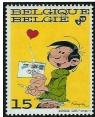
Afb 8. Jeugdfilatelie 1992: Guust Flater

Lucky Luke , "de man die sneller schiet dan zijn schaduw" werd door tekenaar Morris oorspronkelijk getekend voor het tijdschrift Robbedoes , maar verscheen ook in andere bladen. De latere verhalen zijn geschreven