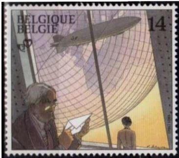
Afb. 11. Jeugdfilatelie 1991 (3): De Duistere Steden

De meeste tot nu toe genoemde striphelden genieten in Nederland een even grote populariteit als in België. Maar er zijn er ook die bij onze Zuiderburen beroemd genoeg zijn om op een postzegel afgebeeld te worden, terwijl hier niemand ze kent buiten een kleine kring van liefhebbers. Dat geldt voor typisch Vlaamse figuren zoals Nero van Marc Sleen (Jeugdfilatelie 1989) en Jommeke van Jef Nys (Jeugdfilatelie 1997).