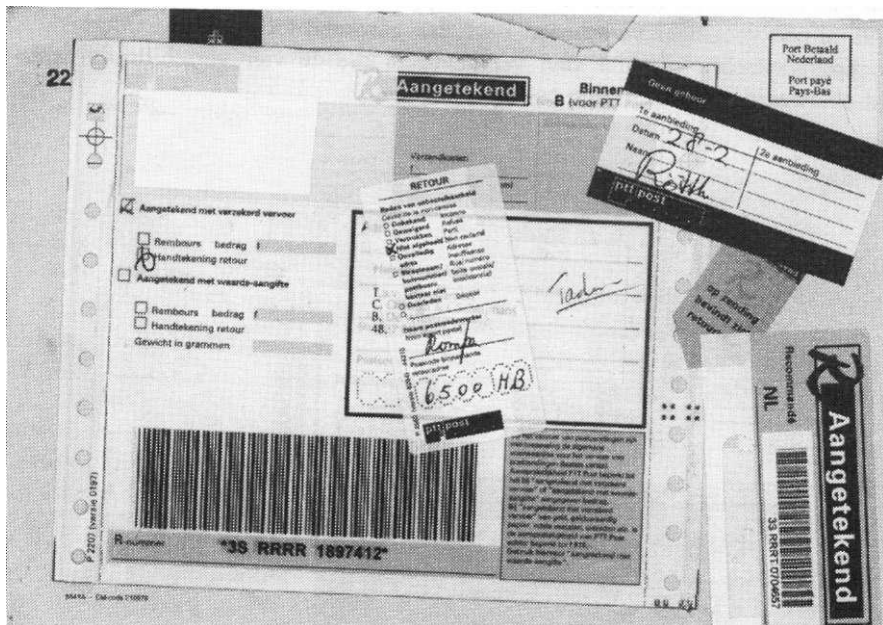
Afb 2. De voorzijde van het stuk: in totaal vijf postale formulieren/etiketten