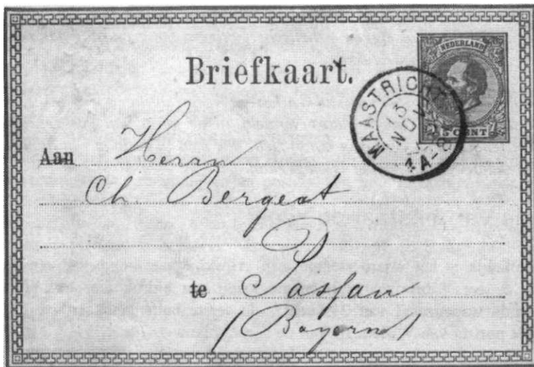
Ab. 4-6 Buitenlandkaart 1873

Bij volgende emissies wordt deze lijn voortgezet: de binnenlandkaart heeft een zegelindruk uit de Cijfer-emissie 1876 en later uit de Cijfer-emissie 1899 (de in 1908 ingevoerde lokale briefkaart eveneens), terwijl voor de buitenlandkaart zegelbeeld en -kleur ontleend worden aan achtereenvolgens de emissies 'Hand haar' en 'Bontkraag'.