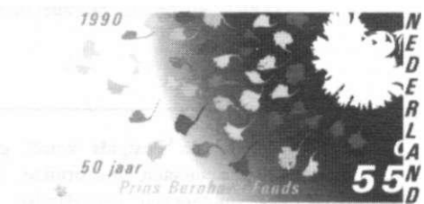
Afb. 25-26 Waardestempel niet meer op postzegelformaat, 1988-1990