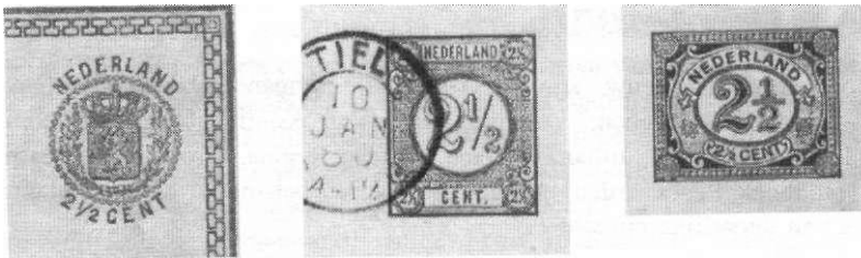
Ab. 1-3 Briefkaarten voor binnenlands gebruik, 1871-1877-1899

Aanvankelijk is het waardestempel een vrijwel exacte kopie van een bestaande zegel: de eerste briefkaart-binnenland krijgt een afdruk die sterk lijkt op de koersende wapenzegel van 2½ cent, de eerste buitenlandkaart wordt getooid met het portret van Willem III van de 5 cent blauw