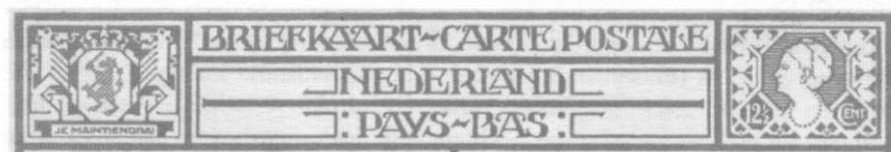
Afb. 13 Speciaal ontwerp, 1924

Als de PTT in 1924 begint met het uitgeven van geïllustreerde briefkaarten (de kaarten met stadsgezichten op de linkerhelft van de adreszijde), wordt aan de vormgeving veel aandacht besteed. Bij deze kaarten maakt de zegelindruk een integraal onderdeel uit van het ontwerp, vandaar dat voor het eerst een zegelbeeld (Koningin Wilhelmina, 12½ cent) gebruikt wordt dat geen enkele relatie vertoont met bestaande postzegels. Ook voor de tentoonstellingskaart uit 1925 (Hugo de Groot) wordt dit zegelbeeld gebruikt.