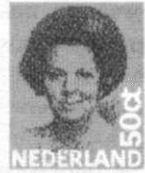
Afb. 23-24 Luchtpost Juliana Regina in blauw en de eerste Beatrix uitgifte

De Beatrix-kaarten tenslotte, kennen een kleurenschema dat volkomen los staat van de overeenkomstige zegelwaarden; als binnenlandkaarten kennen we tot nu toe 50 ct roodbruin (1982) en 55 cent lichtblauw (1986), voor het buitenland 65 ct lichtgroen (1982) en 75 cent roze (1986).