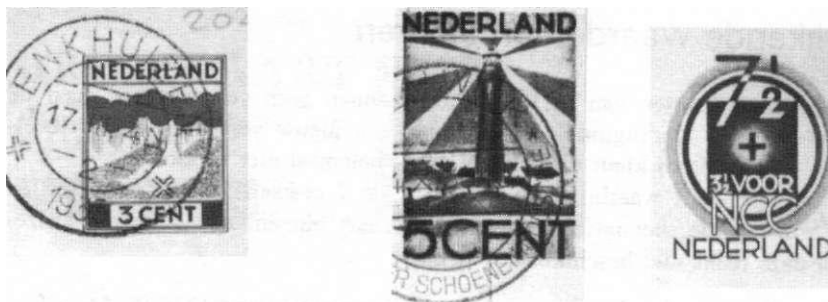
Af. 14-16 Crisishriefkaarten, 1933