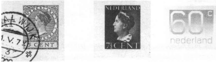
Afb. 7-9 Typen Veth, van Konijnenburg en Crowwel

Over de systematiek in het gebruik van cijfer- en koninginbeelden op postwaardestukken concludeerde C. Stapel in 1983, dat briefkaarten na 1953 altijd een koninginzeegel krijgen en verhuiskaarten altijd een cijferzeegel. Deze systematiek is in de jaren '90 weer doorbroken met briefkaarten in het type Crowwel (60 cent, 70 cent).