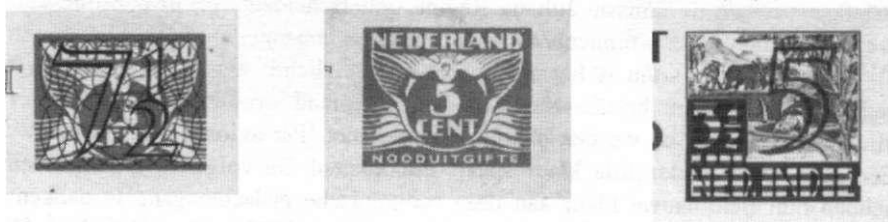
Af. 17-19 Guilloche, nooduitgifte en 'Indische' briefkaart

Als in 1945 een briefkaart van Nederlands Indië geschikt gemaakt moet worden voor gebruik in Nederland, levert dat een exotische zegelbeeld op: onder een rode opdruk blijven de rijstvelden en de karbouw voor de ploeg redelijk zichtbaar.