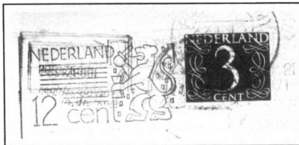
Voorfrankering 12 cent + bijfrankering 3 cent

Dit betekent dat men de voorfrankering dus in 4 vormen zou kunnen vinden nl. 12 cent - 12 cent + 3 cent bijfrankering - 20 cent - en 20 cent + 5 cent bijfrankering. (Ook zou men theoretisch nog kunnen vinden 12 cent met bijfrankering voor het tarief van 20 en 25 cent, indien er nog een voorraad oudere kaarten aanwezig was na 1-11-1971). Voorlopig is het echter zoeken naar de 12 cent baarfrankering. Graag word ik op de hoogte gehouden van nieuwe vondsten op dit terrein.