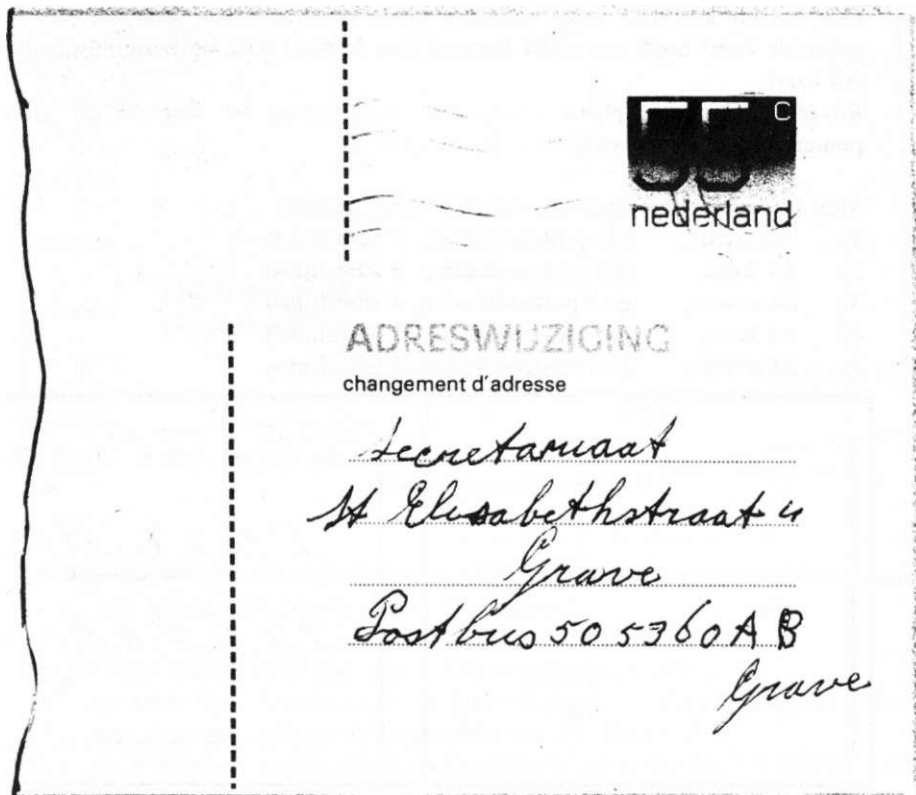
Aflb. 1 Verhuiskaart type Crowwel, afmeting 102 x 148, fosforbalk 2 x 20 mm, 15 + 28 1/2 streepjes