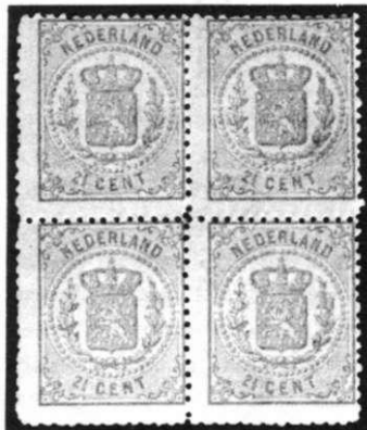
2 1/2 cent lila

Door de tariefswijziging van 1 januari 1870 werd het noodzakelijk, dat er enkele nieuwe waarden aan de bestaande serie werden toegevoegd. Op 19 november 1870 werd de zegel met een waarde van 2 1/2 cent in de kleur lila uitgegeven.