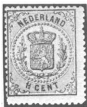
1 1/2 cent roze

Op 10 mei 1869 werd een nieuwe zegel van 1 1/2 cent in de kleur roze uitgegeven, waardoor nieuwe combinaties mogelijk waren.