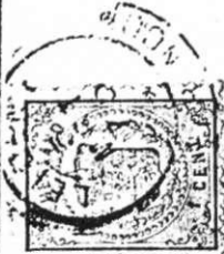
Een drukwerk-omslag, verzonden op 3 maart 1875 van KATWIJK - BINNEN naar WYNBRITSERADEEL