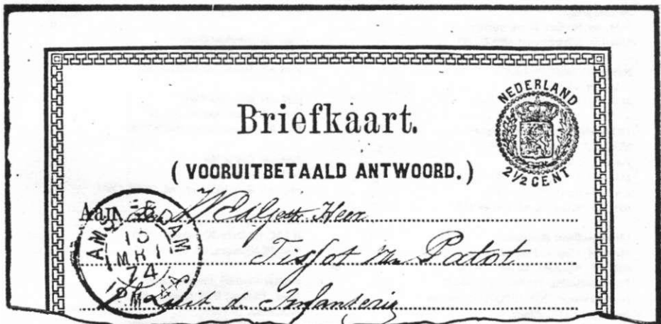
Briefkaart (vooruitbetaald antwoord - zogenaamde antwoordkaart) 13 maart 1874 van Amsterdam naar Leiden.