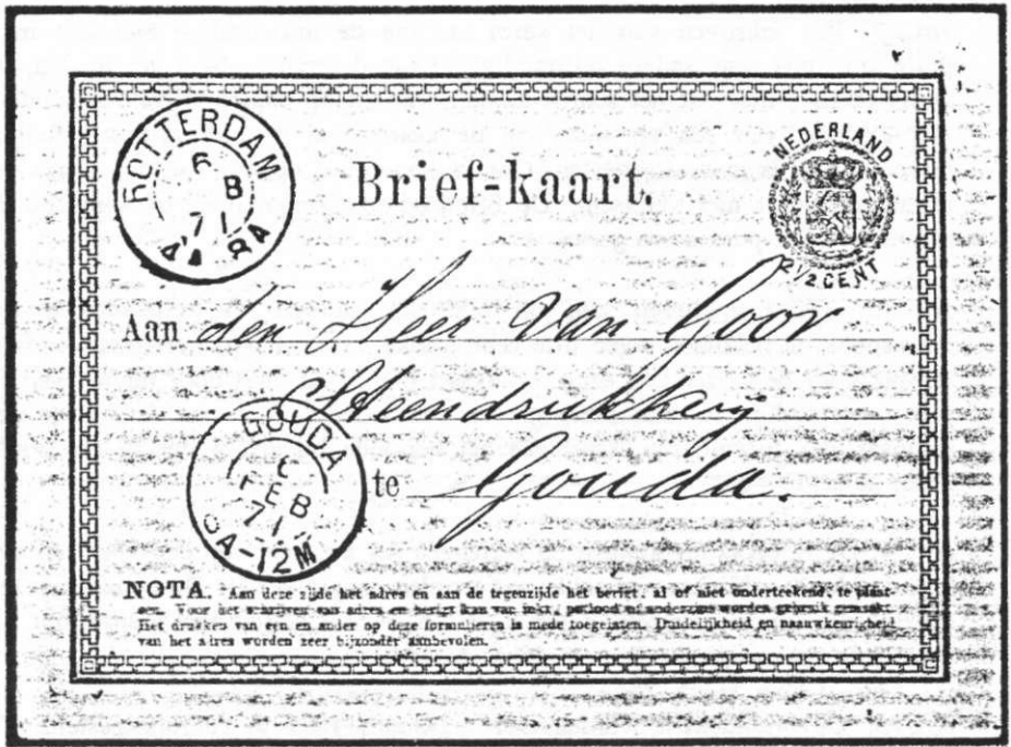
Briefkaart, 18 maart 1874 van Nijmegen naar Deventer.

Bij Resolutie van de Minister van 4 juni 1872 werd de kaart enigzins gewijzigd. De tekst NOTA. enz. werd weggelaten, omdat er veel opmerkingen gemaakt waren over bepaalde woorden.