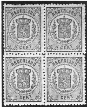
1/2 cent bruin

Tot eind 1876/begin 1877 werden de zegels verkocht en tot 1 november 1879 waren zij geldig.