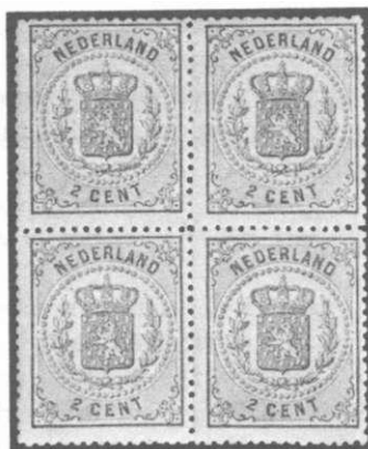
2 cent geel

Op 10 mei 1869 werd een nieuwe zegel van 1 1/2 cent in de kleur roze uitgegeven, waardoor nieuwe combinaties mogelijk waren.