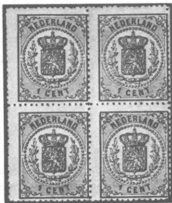
1 cent zwart

Deze drukwerkzegels droegen niet de beeltenis van het staatshoofd. De eerste emissie droeg het rijkswapen en de latere uitgiften, op een enkele uitzondering na, in hoofdzaak alleen het waardecijfer. Per 1 januari 1869 zagen de eerste twee zegels van deze nieuwe emissie het licht.