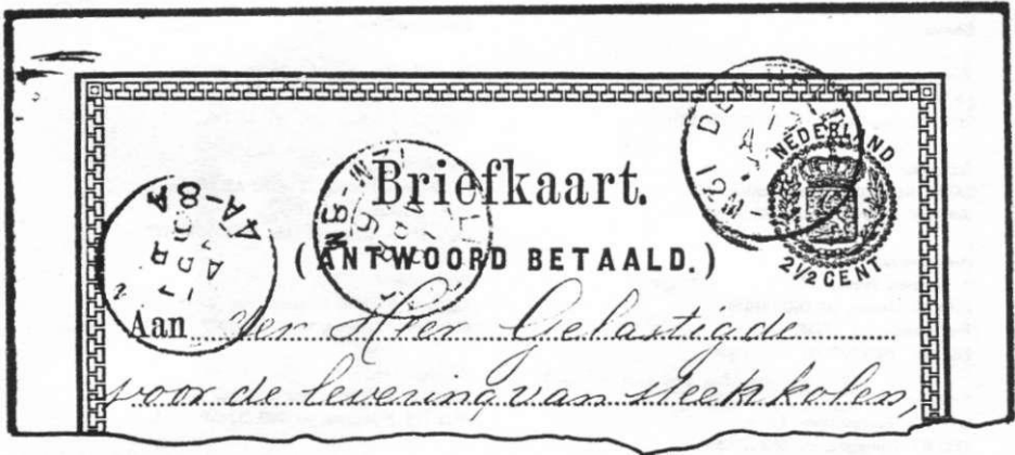
Briefkaart (antwoord betaald - zogenaamde vraagkaart) 17 april 1876 van Den Helder naar Leiden.

Met dezelfde resolutie werd ook de mogelijkheid geopend tot de uitgifte van briefkaarten met betaald antwoord.