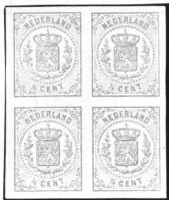
Twee proeven van de 1/2 cent zegel

Per 1 januari 1869 werd het verplicht gesteld om postzegels te plakken, echter met uitzondering voor drukwerken, welke uit een oneven aantal kwart vellen bestonden. Hiervoor bleef de frankering zonder zegels voorgeschreven. Een direct gevolg van het verplicht stellen om de te verzenden drukwerken te frankeren met postzegels was de uitgifte van drukwerkzegels.