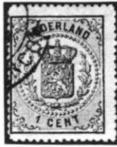
1 cent groen

Bij de nieuwe postwet, welke op 1 januari 1871 in werking trad, werd de tariefberekening naar oppervlakte verlaten en werd een berekening naar gewicht ingevoerd.