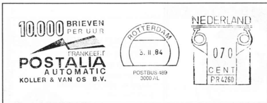
Afb 8 : Afdruk van een Postalia frankeermachine.

Zakelijke post behoeft een andere verwerking dan de particuliere post. Deze post, welke vaak in grote hoeveelheden wordt aangeleverd, hoeft meestal niet worden gestempeld. De post is veelal voorzien van een PORT BETAALD aanduiding, of van een afdruk van een frankeermachine.