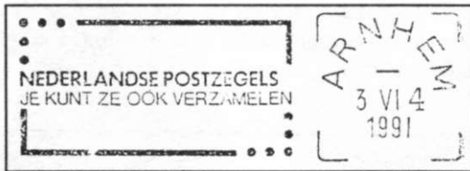
Afb 4 Stempel Flier machine.

Een aantal poststukken wordt alsnog door de SOSMA naar de handverwerking gedirigeerd. Hier wordt de post geschift (groot bij groot en klein bij klein) en opgezet (met adres bovenop en postzegel rechtsboven) en alsnog gestempeld.