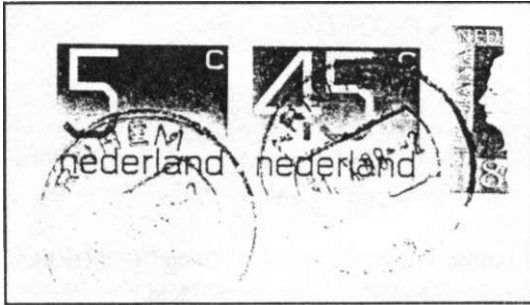
Afb 3 Hamerstempel.