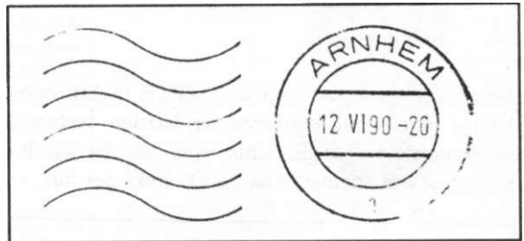
Afb 5 Stempel Klussendorf machine.

De door de SOSMA gestempelde post legt een andere weg af. Deze gaat na stempeling naar de afdeling met de handindexeerapparaten (HIA's) Bij deze handmatige indexering wordt elk stuk in de hand genomen, de postcode wordt inge-