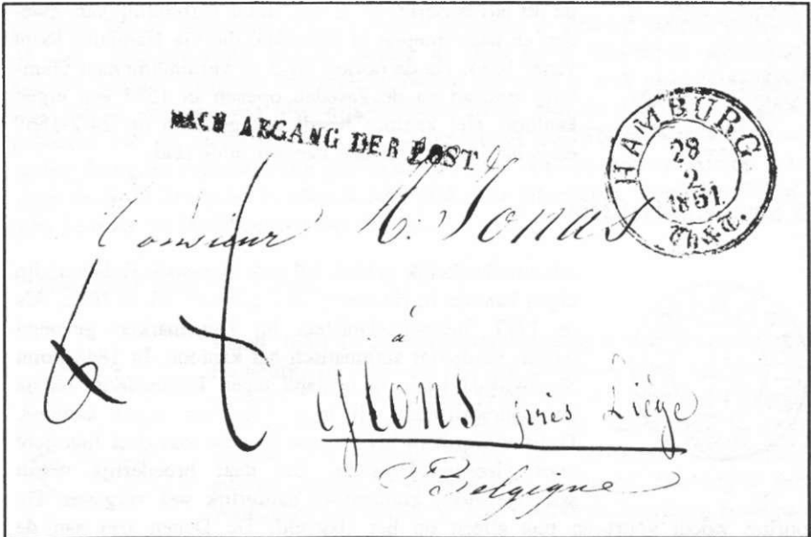
Brief uit 1851 van het Thurn und Taxis kantoor in Hamburg naar Glons in België.

De eerste vreemde postdienst die voor de poorten van de stad verschijnt is die van Thurn und Taxis. Deze postdienst heeft in 1595 het "Generaloberpostmeister"-schap verkregen. Hierdoor is het een Duitse Rijkspost geworden en gemachtigd in het gehele rijk kantoren te vestigen. In 1609 komt het eerste verzoek in Hamburg binnen, maar de magistraten van de stad wenden zich in allerlei bochten om Thurn und Taxis buiten de deur te houden. Dat lukt tot 1615, als voor Thurn und Taxis de maat vol is. De stad weet door allerlei verordeningen nog te verhinderen dat er een echt kantoor komt, maar in 1618 worden alle obstakels door Thurn und Taxis terzijde geschoven en zij opent haar kantoor. De postdienst van Thurn und Taxis neemt al snel de routes naar Keulen en Leipzig over. Het lukt hen echter niet de felbegeerde routes naar Amsterdam en Danzig in handen te krijgen. Het kantoor blijft bestaan tot het einde van de Taxische Post in 1867.