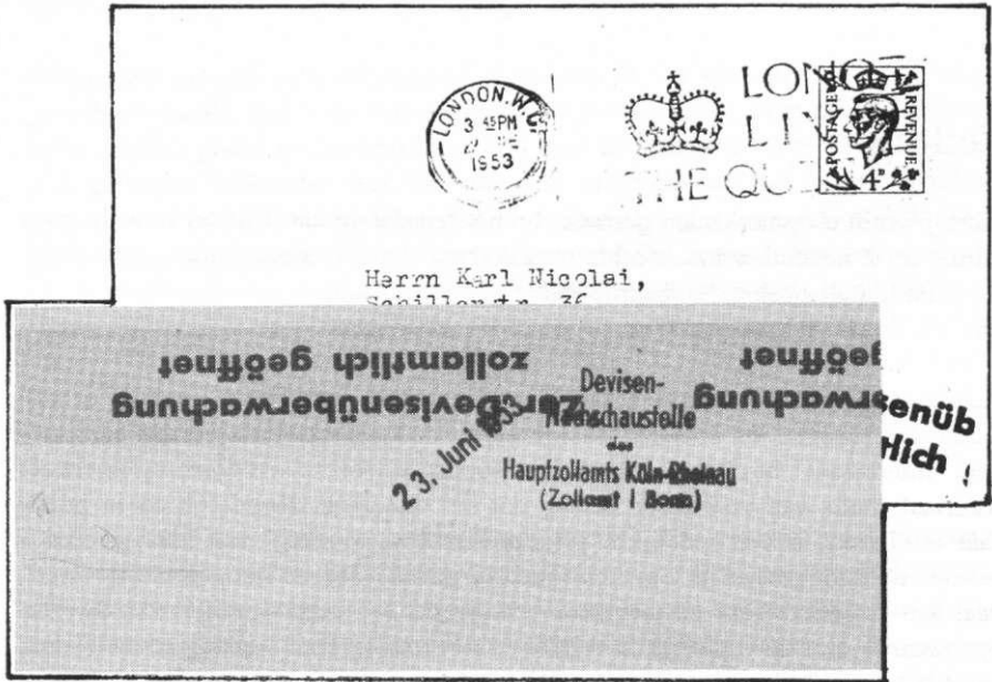
11. Brief, afgestempeld te Londen op 22 juni 1953 en bestemd voor Mainz. Op de achterzijde strook en stempel van de Duitse deviezencontrole.

In Nederland werden deze problemen stevig aangepakt onder leiding van de toenmalige Minister van Financiën Mr. P. Lieftinck. Juist in verband met het ontbreken van deviezen werd hard opgetreden tegen personen die trachtten de verschillende voorschriften te ontduiken. Onder deze overtreders waren veel postzegelverzamelaars: zij hadden jarenlang niet kunnen ruilen met hun buitenlandse relaties, die op hun beurt weer graag de postzegels wilden hebben die tijdens de oorlog in Nederland waren verschenen.