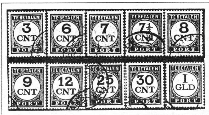
Afb. 9. Tien waarden van de emissie 1921 met de tanding 13\frac{1}{2}:12\frac{3}{4} .