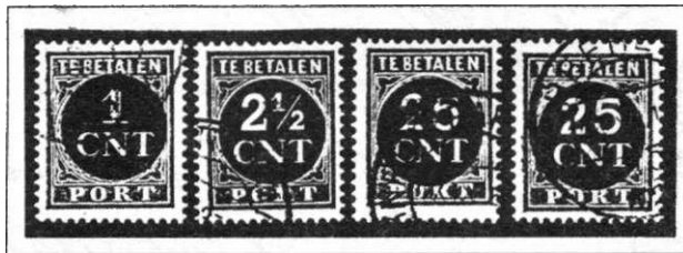
Afb. 8. Vier portzegels van de uitgifte 1912-1921, in 1923 overdrukt met 1, 2½, 25 en 25 CNT in zwart.

1½ CNT op 3 cent, 2½ CNT op 7 cent, 25 CNT op 1½ cent, en 25 CNT op 7½ cent.