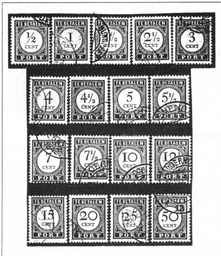
Afb. 4. Zeventien waarden van de emissie 1912 in de tweevoudige en/of enkelvoudige druk en met de tanding 12\frac{1}{2}:12\frac{1}{2} .

Hoewel nu in één kleur werd gedrukt, bleef men toch gebruik maken van twee drukgangen. De aanmaak van nieuwe drukvormen voor elke waarde was blijkbaar te kostbaar. Later begonnen andere argumenten een woordje mee te spreken, zodat men na verloop van tijd toch heeft besloten de zegels in één drukgang te vervaardigen. Ook bij de emissie 1894 volgde men dezelfde werkwijze.