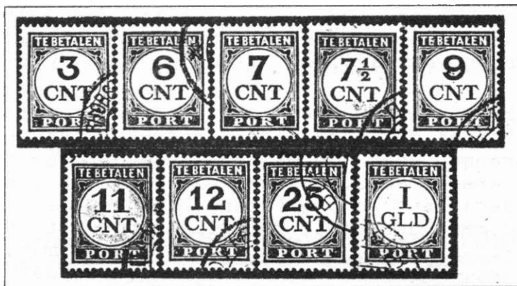
Afb. 6. Negen waarden met de gewijzigde tekening, die tussen 1921 en 1929 in omloop werden gebracht. De tanding was 12\frac{1}{2}:12\frac{1}{2} .

Het is voor een leek nauwelijks doenlijk om vast te stellen tot welke druk (tweevoudige of enkelvoudige) de zegels hebben behoord.