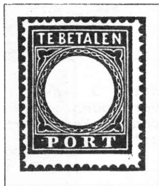
Afb. 2. Afdruk van één losse clichérand. Later werd het waardecijfer in de open ruimte gedrukt.

Toen er door de wijziging van de postwet veel meer portzegels nodig waren, werd een nieuwe emissie voorbereid met in totaal tien waarden. In 1881 werden deze tien zegels uitgegeven. Bij de fabricage maakte men gebruik van de cliché's die voor de twee zegels van 1870 waren vervaardigd. De cijfers 5 en 10 werden verwijderd en de losse randen bleven over. Er bestaan vier typen van deze randen. Wij verwijzen u hiervoor naar bladzijden 196 en 197 van de catalogus van de Nederlandsche Vereeniging van Postzegelhandelaren, 49e editie, 1990.