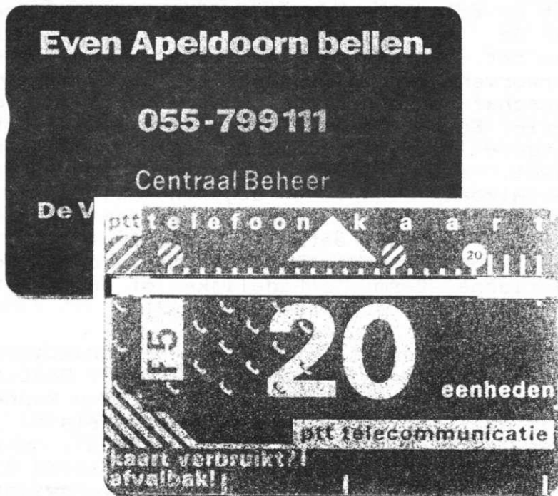
Voorzijde "Standaard"-kaart en achterzijde "Centraal Beheer"-kaart