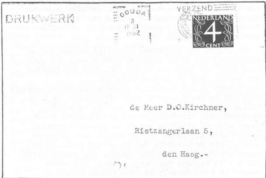
Afb.3. Brief van 8 november 1962, gefrankeerd met de fluorescerende postzegel van 4 ct en gestempeld door de Mark II - facer.

We zien nu dat de totale oplage van de postzegel van 8 ct, volgens de berekening van de Goede, 2/3 bedoeld was voor verzamelaars, en slechts 1/3 voor postale doeleinden te Gouda. Nu zijn er op 27 aug. 1962 toch veel FDC's gemaakt, zij het on-officiële. Gok is er op die dag heel wat post verstuurd uit Gouda: wellicht dacht men hierop een stempelafdruk te krijgen van de Mark II. Maar deze is pas enkele maanden later, op 8 november 1962, voor het eerst gebruikt (Afb.3).