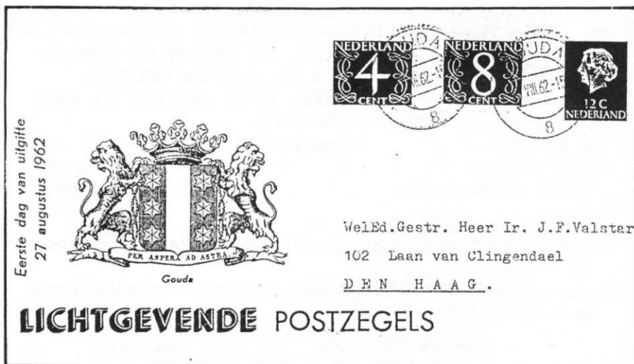
Afb.2. Niet-officiële eerste dag enveloppe Gouda 27 augustus 1962, met o.a. als tekst "lichtgevende postzegels".

Het "bestaan" van deze zegels was al lang bekend: in diverse publikaties van de Studiegroep Postmechanisatie (UV Nederland) en de Studiegroep Velrandbijzonderheden zijn ze (met oplagecijfers) genoemd.