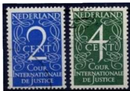
Twee zegels type van Krimpen, uitgegeven in 1950.

In 1950 kwam er een wijziging. De opdrukken gingen vervallen en voor het eerst krijgt het Internationale Gerechtshof eigen postzegels. De bekende kunstenaar J.v.Krimpen krijgt opdracht om twee zegels met een waarde van 2 en 4 cent te ontwerpen, waarbij het woord "COUR INTERNATIONALE DE JUSTICE" in het zegelbeeld was opgenomen. Het resultaat waren zegels, die veel gemeen hadden met de cijferemissie van 1946, die van Krimpen ook ontworpen had. De "Courzegels" waren wat langer om de tekst te kunnen bevatten. In augustus verschenen de zegels. Deze emissie was echter geen lang leven beschoren want een nieuwe volgde snel.