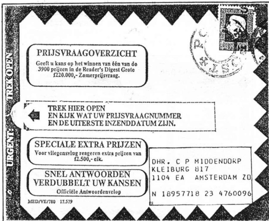
Afb.3 Direct-mail van Raeder's Digest (juli 1980), voorzien van een postzegel en gestempeld met handstempel POST+ POST, (NB: dit is géén machinale frankering noch afstempeling!).

postzegels worden gefrankeerd. We kennen dit al jarenlang van reclame-brieven van Reader's Digest (Afb.3), veelal gestempeld met het stempel POST * POST of ptt-post.