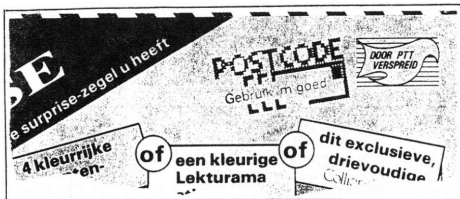
Afb.1 Reklame-post, met de aanduiding "door PTT verspreid".

Reklame per post: U kent het allen wel. Regelmatig vindt U in de brievenbus reclame met de mededeling "door PTT verspreid" (Afb.1). Die reclame is niet "persoonlijk" aan U gericht. Wel staat er soms een aanduiding op die dat moet suggereren: "speciaal voor U" of iets dergelijks. De reclame is echter (door de PTT) huis-aan-huis verspreid.