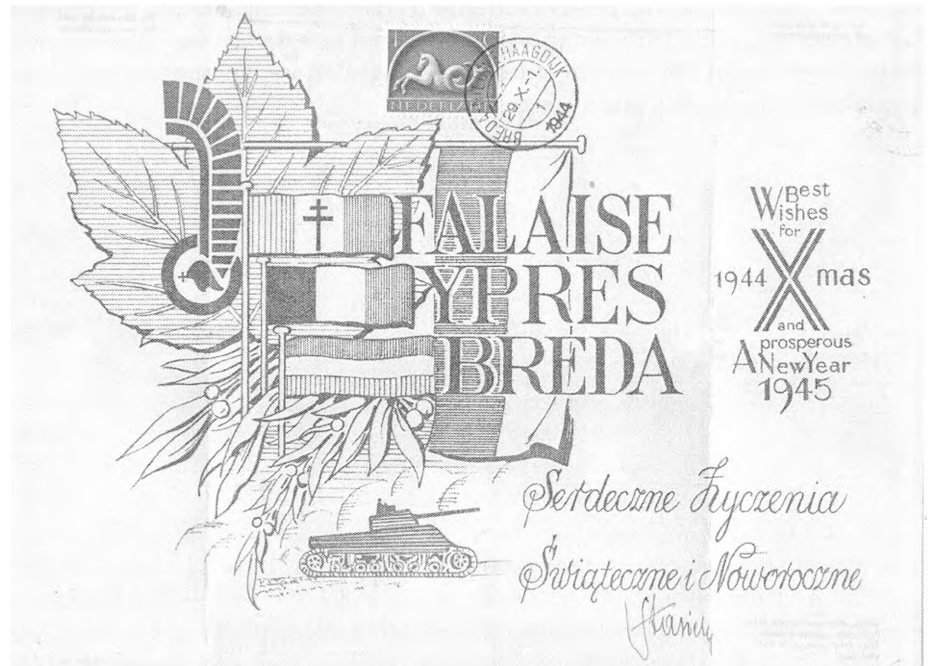
afb. 1 Binnenzijde postblad