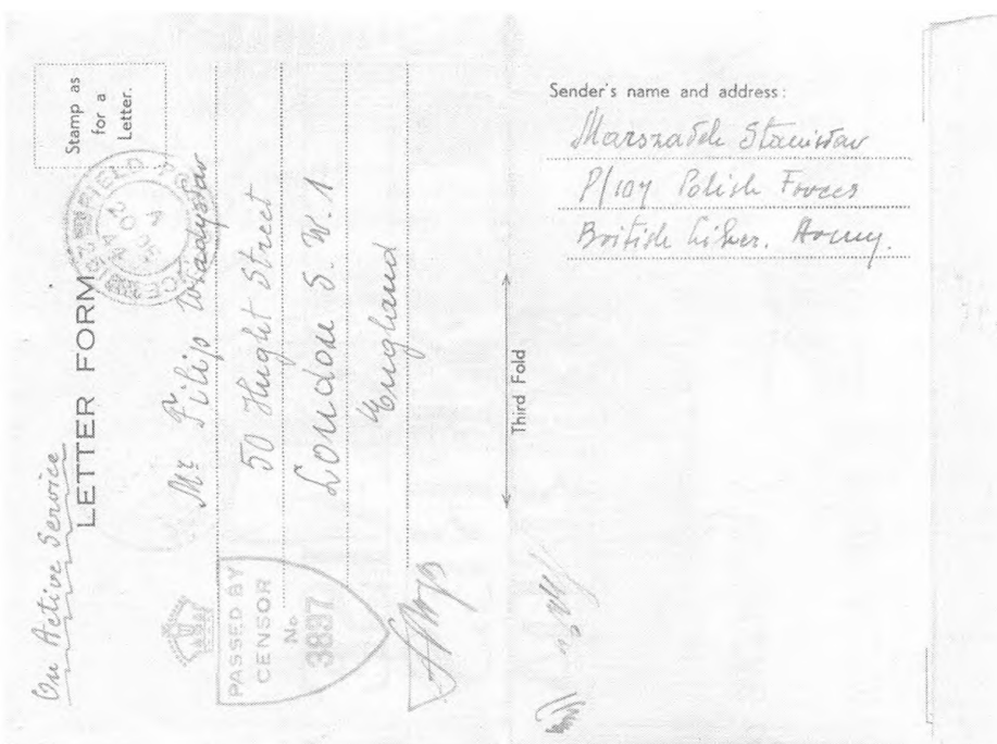
afb. 2 Op de buitenzijde van het postblad de afzender van het postblad

Maar wie was degene die dit postblad had gekocht en in december via de veldpost had verstuurd en van zijn handtekening had voorzien? Het antwoord staat bij naam en adres van de afzender (afbeelding 2) en is niemand minder dan Stanislaw Maczek, de brigade generaal van de 1e Pantserdivisie. Hij stuurde dit postblad naar een Poolse bekende in Londen. Het is aannemelijk dat hij meerdere van deze postbladen verstuurd heeft. Maar voor mijn verzameling is het een uniek stuk.