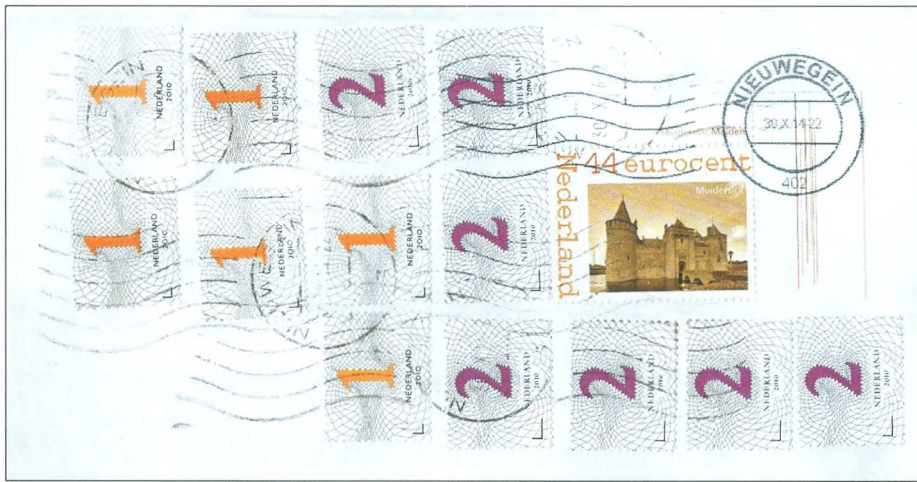
Afb. 2. Fragment van een brief, bijgefrankeerd met "20", met de bedoeling om aan de tariefsverhoging van 20 eurocent (van 0,44 à 0,64) te voldoen....

Terwijl er maar € 0,20 bijgeplakt had hoeven te worden.