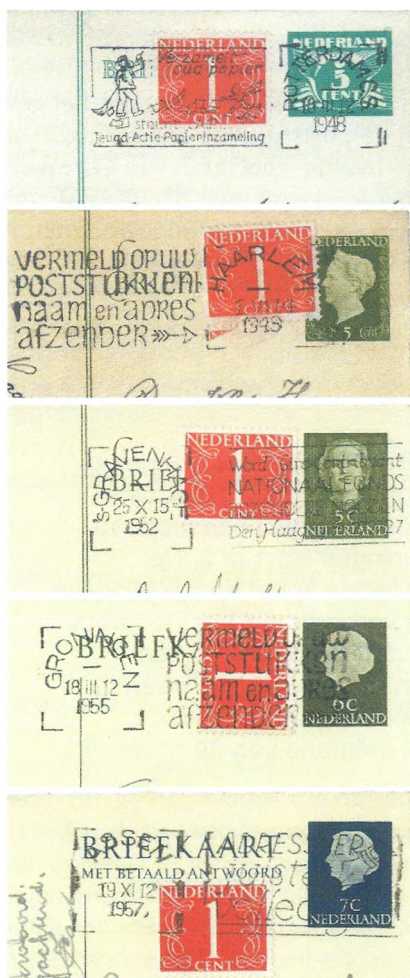
Afb 2: bijfrankering van 1 cent in verband met verschillende tarieven voor lokale en interlokale briefkaarten, of bij tariefsverhogingen in b.v. 1955 en 1957.

NEE ! Al zijn de zegels zelf "massa- waar" - zoals wij filatelisten dat noemen - zo'n stukje papier van een braillestuk is maar zelden bewaard gebleven; dus u heeft in dat geval een filatelistisch juweeltje in handen !