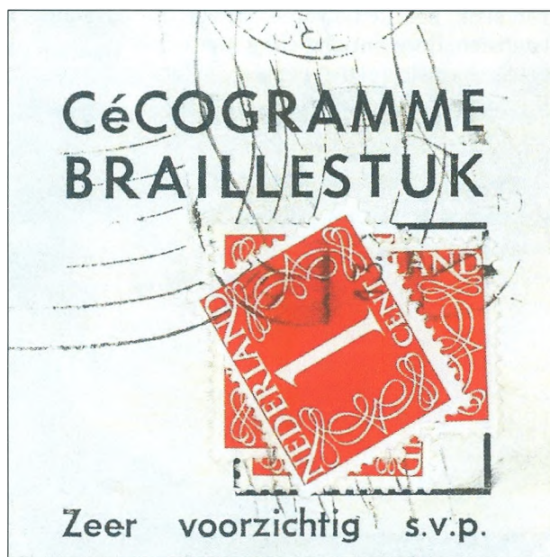
Afb 3: Soms werden braillestukken of cécogrammen heen en teruggezonden, waarbij iedere maal een 1-centzegel op de vorige werd aangebracht en opnieuw gestempeld.

Theoretisch kunnen er ook stukken bewaard zijn gebleven van 2, 3, 4, 5, 6 of 7 cent; dat laatste tarief gold voor 7 kilo of meer. Maar die zijn nauwelijks bekend of bewaard gebleven.