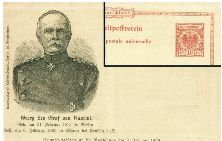
afbeelding 8. Voorkant kaart met inzet deel achterkant

De corridor was voor Duitsland ook van strategisch belang. Ze streefden ernaar om een spoorverbinding tot stand te brengen tussen Duits Zuidwest-Afrika en Duits Oost-Afrika. Dit is er niet van gekomen, omdat Wereldoorlog I roet in het eten gooide. Tijdens die oorlog verloor Duitsland alle koloniale bezittingen.