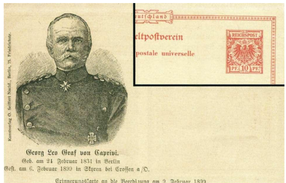
afbeelding 8. Voorkant kaart met inzet deel achterkant

De corridor was voor Duitsland ook van strategisch belang. Ze streefden ernaar om een spoorverbinding tot stand te brengen tussen Duits Zuidwest-Afrika en Duits Oost-Afrika. Dit is er niet van gekomen, omdat Wereldoorlog I roet in het eten gooide. Tijdens die oorlog verloor Duitsland alle koloniale bezittingen.