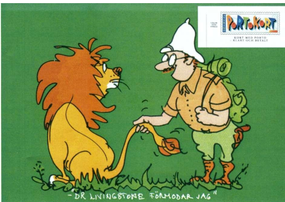
afbeelding 12. voorkant kaart met inzet waardezegel achterzijde.

De bekendste Caprivi-aner-bevolking wordt gevormd door de Mbukushu-stam (13). "Wie zijn ingushi (14) te diep wegdukt, blijft erin steken", is een bekend gezegde van deze stam van vissers en landbouwers.