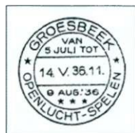
Afb. 18 Het Groesbeek-stempel zoals het staat afgedrukt in het Stempelboek van de PTT, met als datum 14.V.36. Dit is de datum waarop het door 's Rijks Munt werd opgeleverd. Op 16 mei is het naar het postkantoor in Groesbeek gestuurd.

Over de openluchtspelen in Groesbeek schrijft G.G. Driessen in enkele van zijn boeken 1). Het grote Bijbels openluchtspel, genaamd "De Verloren Zoon", werd opgevoerd door de Propagandaclub Leo XIII. Als plaats van handeling was "'t Koepeltje" gekozen, een bosvijvertje met een bijzonder mooie ligging. Tijdens de eerste voorstelling waren er foto's gemaakt, die later als ansichtkaarten verkocht werden (afb. 20). Het decor, de garderobe en de toneelrekwisieten waren door de leden van de Club zelf vervaardigd.