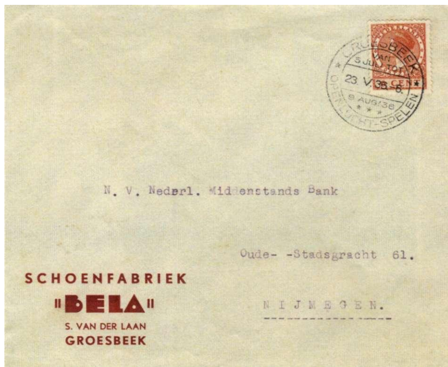
Afb. 19 Brief door schoenfabriek "BELA" in Groesbeek, verzonden naar Nijmegen, met stempel REHS 0032 met reclame voor de Openluchtspelen in juli en augustus 1936.