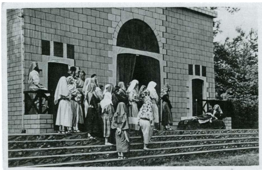
Afb. 20 Eén van de ansichtkaarten van "De Verloren Zoon", met als scene: Hamul geeft de slaven bevelen voor zijn vertrek.