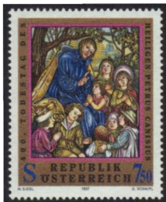
afb 4. Oostenrijkse postzegel bij de herdenking van de 400e sterfdag van Petrus Canisius.

van was de Spaanse Ignatius van Loyola. Ignatius is afgebeeld op een postzegel van het Vaticaan uit 1946, die de 400e verjaardag van het Concilie van Trente herdenkt (afb. 6). Zowel Canisius als Ignatius hebben aan dat Concilie deelgenomen.