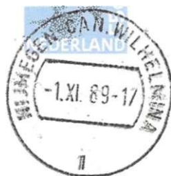
Afb. 3 Cilinderbalkstempel van het PTT agentschap in het Canisius-Wilhelmina ziekenhuis, vanaf 1989 in gebruik geweest.