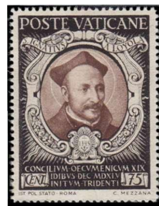
afb 6. Postzegel van Vaticaanstad, met afbeelding van Ignatius van Loyola.

1) De Canon van Nijmegen, uitgeverij Vantilt, ISBN 9789460040351, 2009. Venster 16: een Nijmeegse heilige: blz. 70-73.