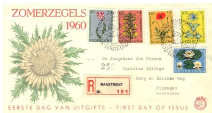
afb 1. Eerste dag enveloppe van de zomerzegels van 1960, gericht aan een leerling van het Canisius College aan de Berg en Dalscheweg !