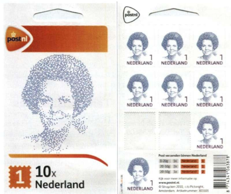
Afb. 3 Hangboekje Beatrix 1 (voor- en achterzijde)

In dit artikel laten we zien in hoeverre PostNL al gevorderd is met de invoering van de nieuwe huisstijl.