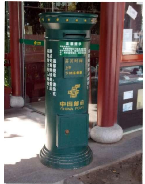
Brievenbus bij de "Yellow Crane Tower".

De toegangkaart vond ik erg groot, maar op de voorkant prijkte naast de controlestrook een mooie afbeelding van de Yellow Crane Tower. Op een gegeven moment keek ik bij toeval op de achterkant van de toegangkaart en zag daarop de tekst "china post" en een voorgedrukte zegel met als beeld de toren. Navraag bij mijn begeleidsters leerde mij dat de kaart verstuurd kon worden in het binnenland. Van hen kreeg ik de kaarten zodat ik nu over 3 exemplaren beschikte. Een ongebruikt exemplaar had ik nodig om te kunnen laten zien hoe het eruit zag.