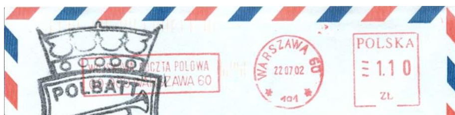
Afbeelding 4, Bovenkant van een brief uit 2002 met frankeermachine stempel uit de periode na de geldhervorming.

De Poolse brieven en kaarten waren altijd ruim voorzien van niet postale stempels die aangaven dat de post uit Syrië kwam. We zien dat duidelijk in afbeelding 2 en 3. Dat is dus sinds kort afgelopen.