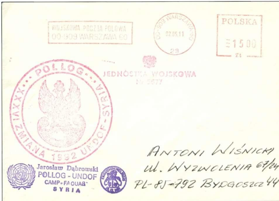
Afbeelding 2, Frankeermachine stempel van het kantoor Warszawa 60 uit 1992 in Poolse Zlotys van voor de geldhervorming.

De post van de Poolse militairen ging naar het postkantoor Warszawa 60 in Polen. In het begin was de post voorzien van het stempel "wojskowa-bezplatna" (militair-gratis), afbeelding 1. Later werd de post voorzien van postzegels of werd een stempelafdruk met een frankeermachine geplaatst. In afbeelding 2 zien we een afdruk van een frankeermachine uit 1992 met de zloty waarde van voor de geldhervorming in 1995. Afbeelding 3 is een envelop voorzien van een postzegel met letter A van vlak na de geldhervorming. Afbeelding 4 tenslotte is een brief met stempel in de nieuwe zloty waarde uit 2002.