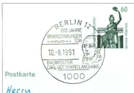
Afb. 2 Ontwerper Carl Gotthard Langhans

De aanleiding tot de bouw was de opdracht van de toenmalige Pruisische Minister Johann Christoph von Woelner in 1769 tot "Verschönerung der Residenz-Städte Berlin und Potsdam durch Errichtung vortrefflicher Gebäude".