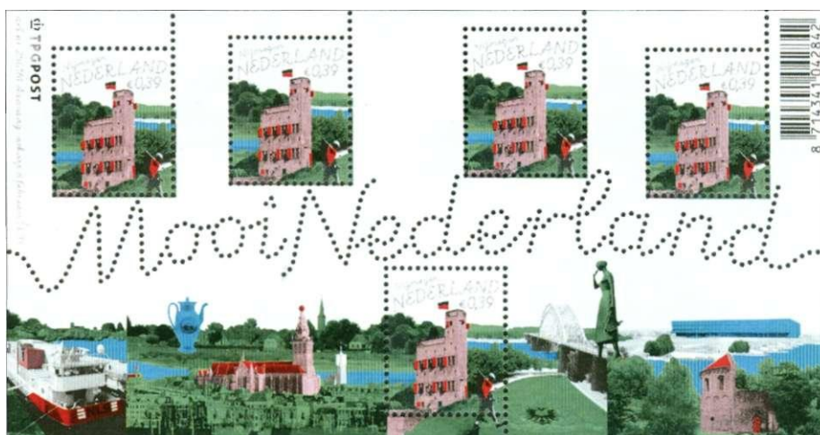
Afb. 5 Valkhofburcht in Nijmegen.

*Voor complete informatie over De Nederlandse Revolutie, Joost Rosen daal. ISBN 9077503188;