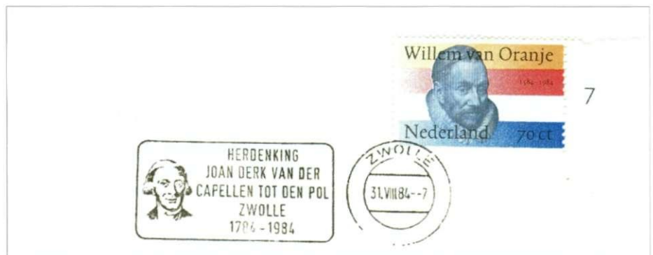
Afb. 6 Stempel baron Joan Derk van de Capellen tot den Pol.

Het vervolg! U raadt het al, er moest betaald worden.