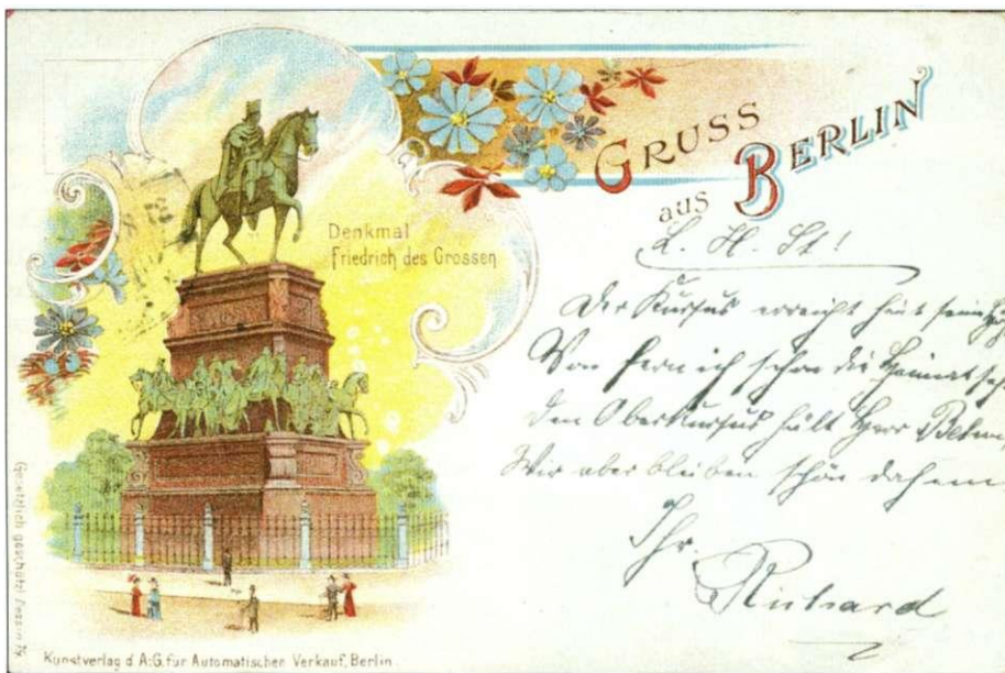
Afb. 4 Standbeeld van Friedrich der Grosse.

Vrede mee (Brandenburger Tor). Deze bouwde hij ter herinnering aan de overwinningen van zijn oom, Frederik de Grote, en, niet te vergeten, de vrede die hij aan de Nederlanden had gebracht.