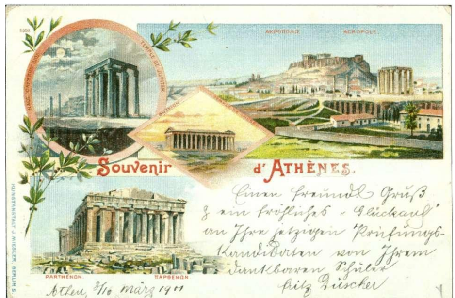
Afb. 3 De Propyleeën op de Acropolis van Athene, die als voorbeeld dienden.