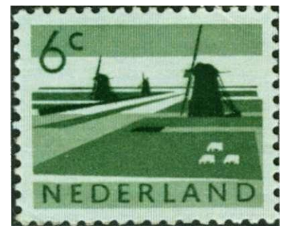
Afb. 7 Het Hollandse landschap bij Goejanverwellesluis.

Begin 1787 liet de stadhouder zijn gemalin Wilhelmina van Pruisen, zuster van de Pruisische koning Frederik II, een poging doen, zijn macht in Holland te herwinnen. Haar reis naar den Haag moest het startsein geven voor de contrarevolutie. Ze werd echter op 28 juni 1787 bij Goejanverwellesluis (huidige gemeente Driebergen-Z.H.) (7 en 8 ) tegengehouden door een "Commissie van Defensie". Ze was daar, volgens de Pruisen, door in haar aanwezigheid rokende revolutioneren, "onheus bejegend". Zo behandelt men geen Pruisische prinses!!! "Het gebeuren van Goejanverwellesluis" genaamd, was de aanleiding voor de inval door de Pruisen.