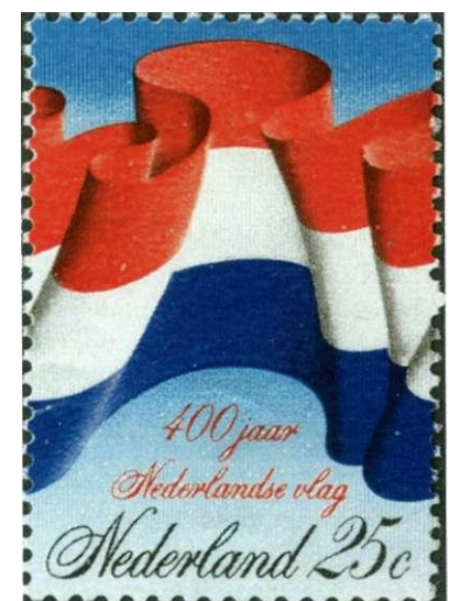
Afb. 8 De Nederlandse vlag.