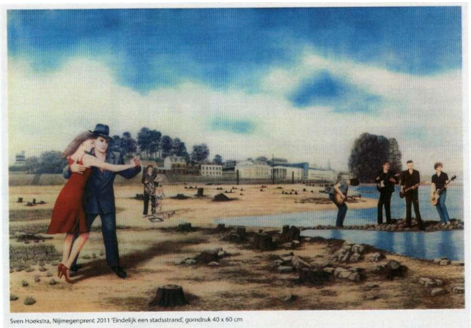
Sven Hoekstra, Nijmegenprent 2011 'Eindelijk een stadsstrand', gormdruk 40 x 60 cm

Afbeelding van de uitgegeven kunstkaart. Meer informatie over de zegels met hetzelfde motief op pagina 2.