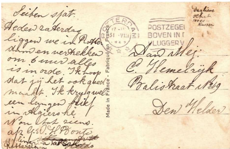
Afb. 2 Kaart in 1929 vanuit Rotterdam verzonden aan Mej. C. Hemelrijk, vermoedelijk door een matroos aan boord van een schip. De tekst is vrij neutraal, paps en mams mogen gerust meelezen. Maar de belangrijkste woorden: "Dag lieve schat, 1000 kussen" zijn verstopt onder de postzegel!

De tekst onder de postzegel was vaak uitsluitend bedoeld om "ongezien" te blijven voor ongewenste nieuwsgierigen. Afb. 2 laat een kaartje zien met heel veel tekst, en dat zal dus zeker gefrankeerd zijn als briefkaart. Motief om woorden onder de postzegel te verstoppert was kennelijk niet een geldelijk gewin, maar had een ander doel!