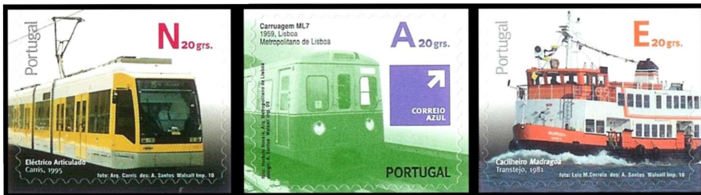
Afbeelding 14: Portugal: combinatie van letter en gewicht.