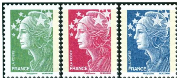
Afbeelding 18: Frankrijk: Marianne in UPU-kleuren

In Portugal is men al een eind op weg, daar combineert men tegenwoordig letters met een gewichtsaanduiding: 'N' (binnenland), 'A' (azul, priority), 'E' (Europa), telkens aangevuld met '20 grs.'.