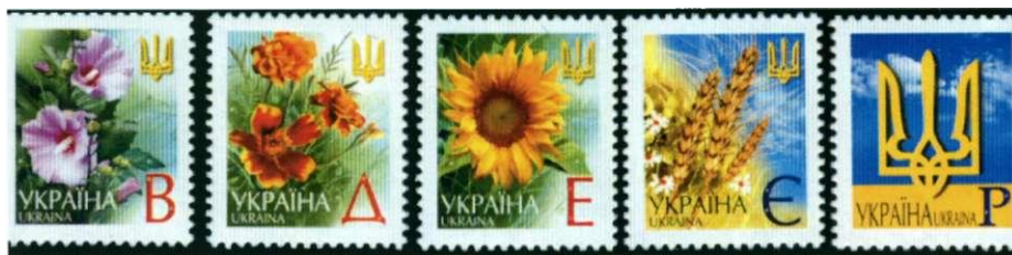
Afbeelding 11: Cyrillische lettertekens uit Oekraïne

Ook in de nieuwe staten van de voormalige Sovjet-Unie kent men letterzegels. We tonen u enkele voorbeelden uit Oekraïne. In 2001 werd een reeks van zes permanente postzegels 'Bloemen en symbolen' uitgegeven met aanduidingen in cyrillische lettertekens. Op het moment van uitgifte hadden deze zegels de volgende waarde: B = 0,10 grivna, D = 0,30 grivna, E = 0,70 grivna, X = 2,66 grivna, € = 3,65 grivna, P = 10,84 grivna. Interessant aan deze zegels is de beveiliging tegen namaak: in elk letterteken is hetzelfde teken enkele keren in heel klein formaat uitgespaard in wit.