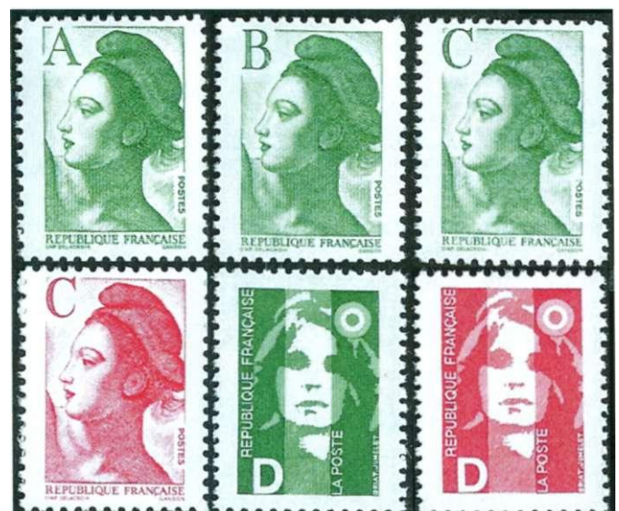
Afbeelding 8: Franse letterzegels.

bekend om dat nog voor elkaar te krijgen. De letterzegels worden dus gedrukt voordat hun waarde bekend is. Zo kreeg de 'A'-zegel uit 1978 een waarde van 15 dollarcent en de ver-