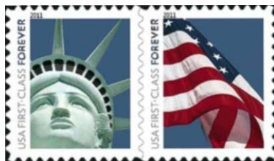
Afbeelding 17: Verenigde Staten, First class forever

brief tot 20 gram in het gereduceerde tarief ( écopli ), de rode voor een gewone binnenlandse brief tot 20 gram en de blauwe voor een brief tot 20 gram naar Europese bestemmingen.