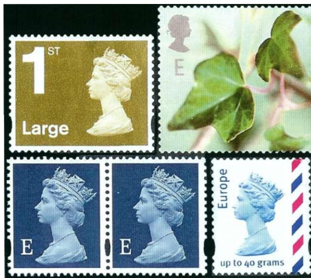
Afbeelding 13: Uitbreiding van het Britse systeem

oorspronkelijke aanduidingen voor first class en second class , kent men nieuwe aanduidingen, zoals 'E' voor Europese bestemmingen en 'W' voor bestemmingen in de rest van de we-