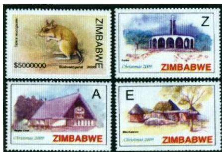
Afbeelding 12: Zimbabwe: oud en nieuw

In Zimbabwe, het land met de hoogste inflatie ter wereld, kijkt men niet op een paar nullen meer of minder bij geldbedragen. Een eenvoudig zegeltje uit 2008 heeft bijvoorbeeld een nominale waarde van $ 5000000 (zonder punten tussen de duizendtallen). Vijf miljoen Zimbabwaanse dollars, en nog niets waard... Bovendien is die munteenheid de afgelopen jaren enkele keren gedevalueerd, waarbij er 6 nullen verdwenen. Alle reden om postze-