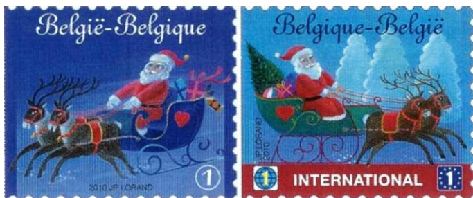
Afbeelding 7: Cijfers en symbolen op de Belgische Kerstzegels.

In België heeft men al enige tijd cijferzegels die vergelijkbaar zijn met de Nederlandse. Postzegels voor binnenlands gebruik zijn bij onze zuiderburen voorzien van een cijfer in een cirkel. Bij zegels voor zendingen binnen Europa staat het cijfer op een blauwe cirkel met gele sterren en bij zegels voor de rest van de wereld staat het cijfer op een gestileerde globe. Een elegante grafische oplossing, waarmee bovendien de taalkwestie omzeild wordt. Op de Kerstzegels van 2010 zijn de drie symbolen te zien: de ene zegel is bedoeld voor binnenlands gebruik, de andere mag voor bestemmingen binnen én buiten Europa gebruikt worden.