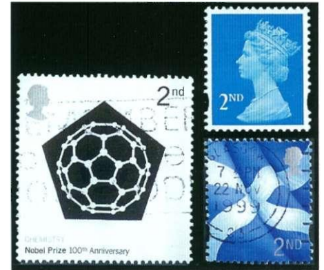
Afbeelding 6: Britse postzegels second class

Ik denk eerlijk gezegd dat het voor de gemiddelde consument niet veel uitmaakt, postzegels met een aanduiding '€0,44' of met een aanduiding '1'. Maar als TNT Post het ons echt gemakkelijker had willen maken, had men eens kunnen kijken naar de oplossingen van andere postadministraties.