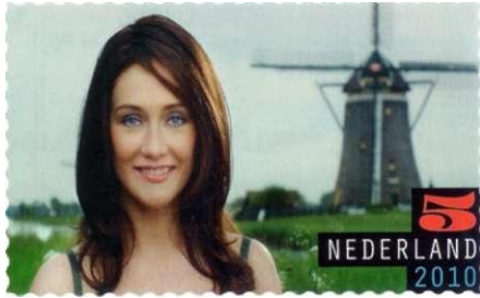
Afbeelding 2: de filmzegel

Op 1 juli 2010 introduceerde TNT Post een nieuw soort postzegels. 'Onze postzegels krijgen een cijfer', was de slogan bij de reclamecampagne. 'Voortaan staat er geen euroaanduiding meer op de postzegels, maar een cijfer'. Want: 'TNT Post maakt frankeren makkelijker'. Makkelijker voor wie? Dat werd er niet bij verteld.