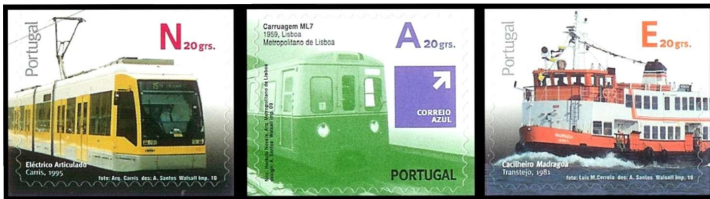
Afbeelding 14: Portugal: combinatie van letter en gewicht.