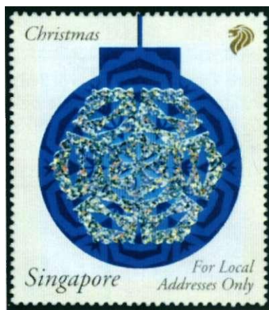
Afbeelding 15 For Local Adresses Only

reld. Maar het kan nog nauwkeuriger: tegenwoordig zijn er ook postzegels met de aanduiding '1st Large' en '2nd Large' voor grotere brieven en met de aanduiding 'Europe up to 40 grams'. Dat begint erop te lijken!