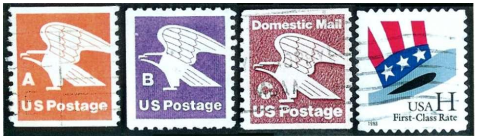
Afbeelding 9: Amerikaanse letterzegels.

In veel landen worden 'waardelose' postzegels niet voorzien van cijfer-aanduidingen, maar van letters. Daarmee is het meteen duidelijk dat er geen concreet bedrag bedoeld is. In Frankrijk kent men zogeheten 'Timbres à validité permanente', postzegels die onbepaald geldig zijn. De zegel van het type 'Liberté' met aanduiding 'A' uit 1986 werd een jaar later gevolgd door een zegel met aanduiding 'B' en in 1990 door een zegel met aanduiding 'C' van hetzelfde type. De 'D'-zegel uit 1991 was van het inmiddels geïntroduceerde type 'Marianne de Briat'. Maar een binnenlandse brief kon op dat moment nog steeds gefrankeerd worden met elke andere 'letterzegel', zonder bijfranking. Waarom sommige Franse letterzegels in groen en in rood uitgebracht werden, zullen we later zien.