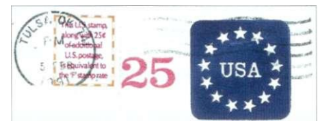
Afbeelding 10: 'make-up stamp' op een voorgefrankeerde envelop van 25 dollarcent (fragment).

schillende 'F'-zegels in 1991 een waarde van 29 dollarcent. In dit verband moet ik even wijzen op de postzegel met de ingewikkeldste tarief-aanduiding aller tijden. Toen het standaardbrief-tarief per 22 januari 1991 verhoogd werd van 25 naar 29 dollarcent, waren er nog enorme aantallen zegels van 25 dollarcent in omloop. Er was dus behoefte aan een aanvullingswaarde, ofwel een 'make-up stamp'. Maar aangezien ook de bijplakzegel gedrukt moest worden voordat het nieuwe tarief bekend was, heeft men daarvoor de volgende oplossing gekozen: een zegel met de tekst 'This U.S. Stamp, along with 25c of additional U.S. postage, is equivalent to the 'F' stamp rate', oftewel: 'Deze postzegel vormt samen met 25 dollarcent aan aanvullende frankering het F-tarief'.