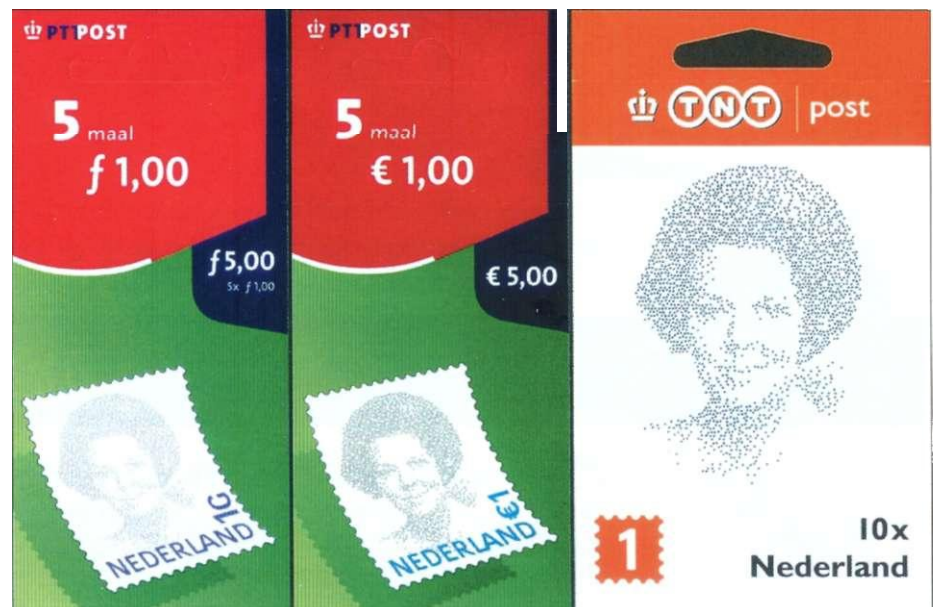
Afbeelding 5: Beatrix-postzegels met 'enen'

In het buitenland kunnen de aanduidingen in cijfers tot verwarring leiden. In Groot-Brittannië bijvoorbeeld kent men twee soorten binnenlandse post: first class en second class , te vergelijken met wat wij op zijn Nederlands priority en standard noemen. Veel Britse zegels zijn voorzien van een '1' voor first class of een '2' voor second class . Ik hoop dat TNT Post geen postzegels gaat uitgeven met de aanduiding 'Europa 2'. Wie een brief naar Groot-Brittannië met een dergelijke zegel zou frankeren, loopt de kans dat zijn brief daar als second class behandeld wordt en later aankomt.