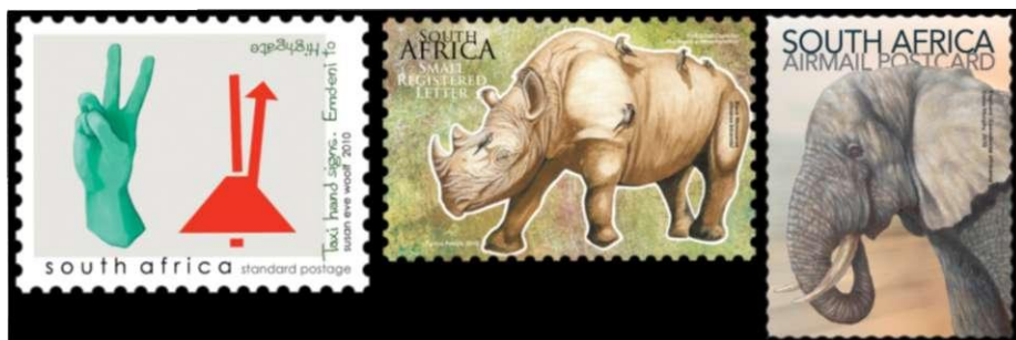
Afbeelding 16: Zuid-Afrika