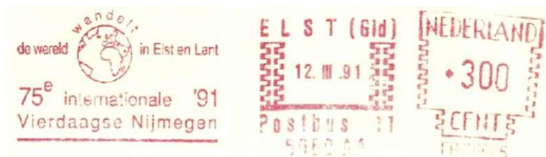
Afbeelding 11: Stempel "De wereld wandelt in Elst en Lent", doorkomst gemeente op de eerste wandeldag.