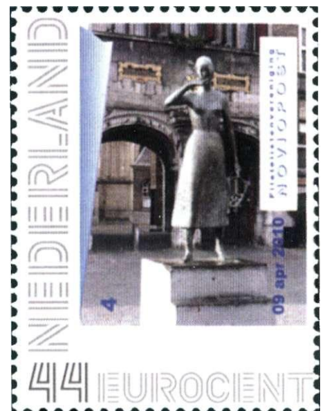
Persoonlijke postzegel nummer 4 van Noviopost.

Redactie: J. Mulder J. Spijkerman J.M.A.G. Stroom